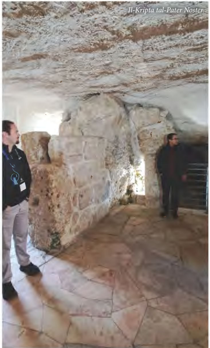
Il-Kripta tal-Pater Noster

Fl-ewwel snin tas-seklu 4 dan l-għar fuq l-Gholja taż-Żebbuġ gie identifikat mit-tradizzjoni Kristjana bħala l-Post li fih Ġesù kien jingabar mal-Appostli u li minnu tela' s-sema. Fuq kollox dan il-Post kien marbut mal-profesizzjoni ta' Ġesù dwar il-qerda tat-Tempju u t-tieni miġja tiegħu fl-aħħar żminijiet. Wara li l-Imperatur