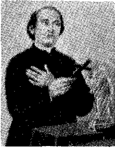
Ven. Nazju Falzon: