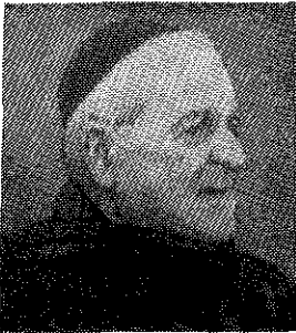
Dun Ġorġ Preca: