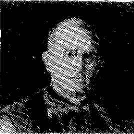
Dun Karm Psaila:

Il-Poeta Nazzjonali kien devot kbir tal-Madonna tal-Karmnu. Fl-1955 inkiteb fit-Terz Ordni Karmelitan u fl-20 ta' Ġunju ta' l-1956 ipprofessa fit-Terz' Ordni kemm Mons Carmelo Psaila kien ihobb lill-Madonna m'hemm x b'żonn ngħiduh: jafu kulhadd u jixhduh il-poeziji tiegħu: b'mod partikolari tidher il-qima tiegħu lejn il-Madonna tal-Karmnu u t-tama tiegħu fiha, fil-poezija "Lill-Madonna tal-Karmnu."