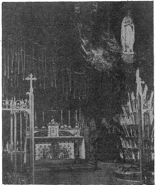
Jiena jien l-Immakulata Kuncizzjoni. Hekk qalet is-Sinjura l-Bajda lil Bernardette Soubirous

Il-Papa Ġwanni Pawlu II, li bid-dritt kollu