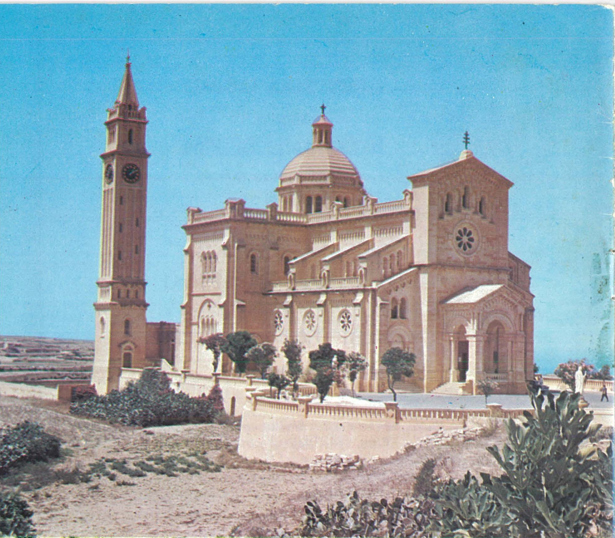
IS-SANTWARJU TA' PINU MIBNI WARA LI L-MADONNA KELI-MET LIL KARMNI GRIMA.

"Il-Verġni Marija li mit-thabbira tal-Anġlu laqgħet f'qalbha u f'għisimha l-Verb t'Alla u ġabet il-hajja lid-dinja, hu magħrufa u unurata bħala vera omm ta' Alla u tar-Redentur. Hi stess meħlusa b'mod sublimi, in vista tal-merti ta' Binha u Mieghu marbuta minn rabta iebsa li ma tinhallx, hi mghonija b'uffiċċju l-aktar għoli u bid-dinjità ta' Omm tal-Iben t'Alla, u għalhekk bint maħbuba tal-Missier u tempju tal-Ispirtu s-Santu: u li minhabba dan id-don tal-grazzja l-aktar għolja tisboq b'mod kbir lill-kreaturi l-oħra kollha fis-sema u fl-art. Hi madankollu marbuta flimkien mar-razza ta' Adam mal-bnedmin kollha fi htieġa tal-fidwa, anzi hi "tassew omm tal-membri (ta' Kristu) ...għaliex ikkooperat bl-imhabba għat-twelid tal-fidili tal-Knisja, li ta' dak ir-Ras huma membri". Għal dan hi magħrufa wkoll bħala l-membri singolari u ewlenija tal-Knisja u figura tagħha u mudell l-aktar perfett ta' fidi u ta' karità, u l-Knisja Kattolika, mghallma mill-Ispirtu s-Santu bl-imhabba ta' pietà ta' bint tiuveneraha bħala Omm l-aktar maħbuba".