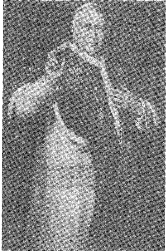
Il-Papa Piju IX

Fil-Bulla tad-definizzjoni Dommatika, il-Papa Piju IX għamel riferenza għal dan il-