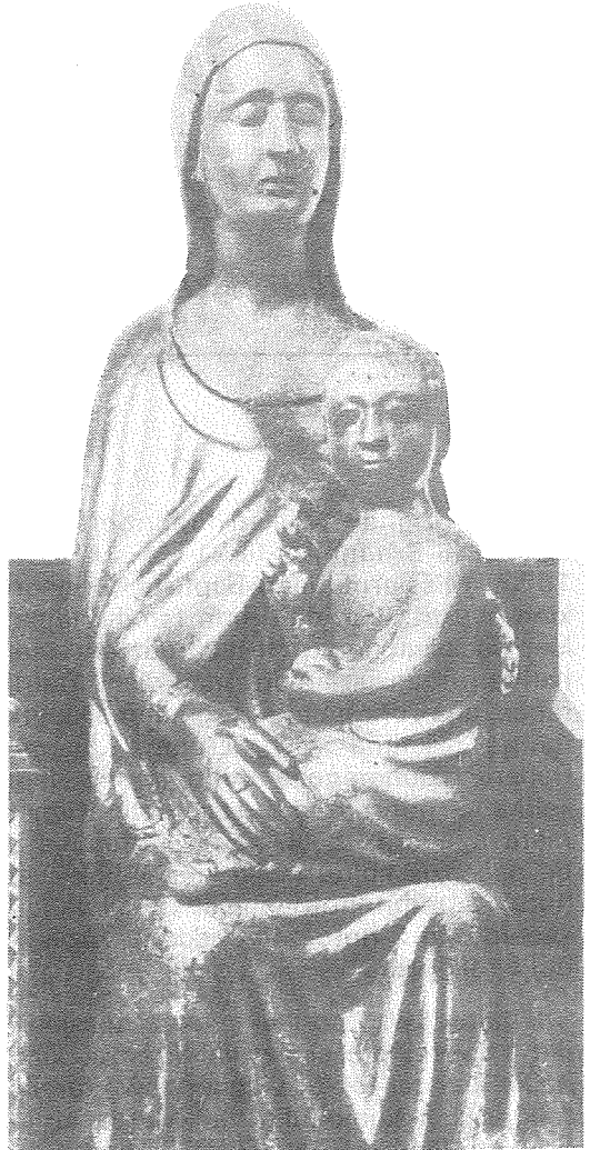
II-Madonna tat-Tempesta fil-knisja ta’ S. Maria Nuova, Tolentino (Statwa tal-Injam stil Bizantin).

It-traduzzjoni bil-Malti tal-Akathistos deheret fi “Il-Leñen is-Sewwa” fix-xahar ta’