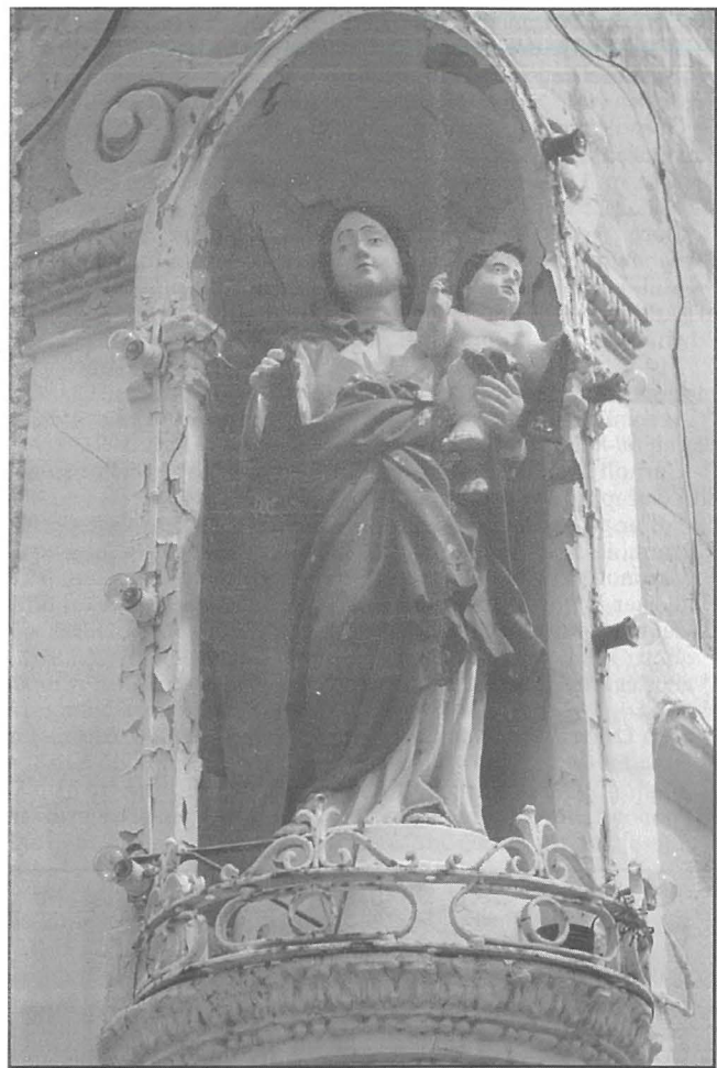
Statwa tal-Madonna tal-Karmnu li tinsab f'kantuniera f'Tas-Sliema