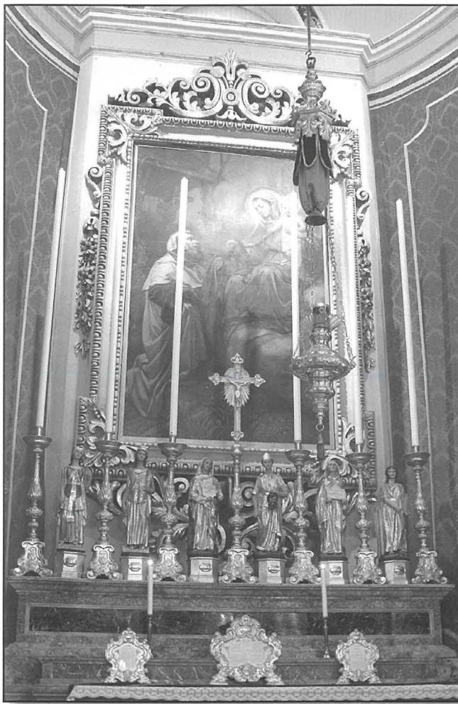
L-artal tal-Madonna tal-Karmnu fil-Parroċċa tal-Madonna tas-Sacro Cuor f'tas-Sliema.