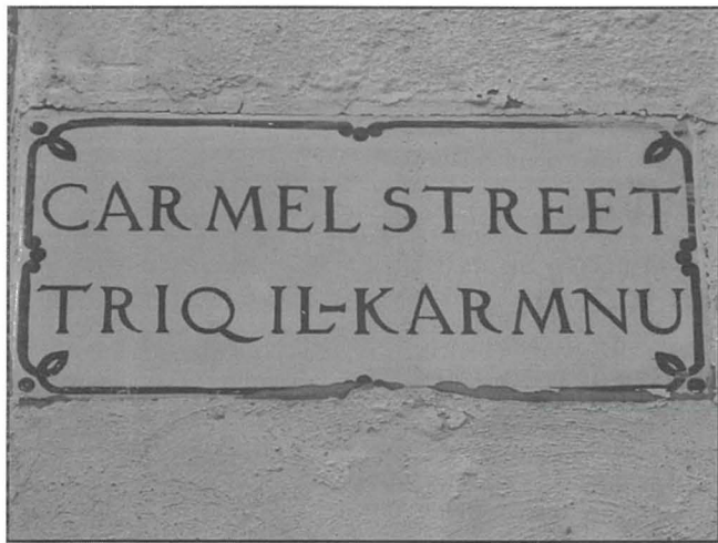
L-isem tat-Triq il-Karmnu f'Tas-Sliema

F' tas-Sliema, b'hal bosta partijiet oħra f'Malta u Għawdex, insibu triq iddedikata lill-Madonna tal-Karmnu, "Triq il-Karmnu". Imxerrdin mat-toroq ta dan is-Subburg Marittimu insibu ukoll hmistax il-niċċa bi statwi tal-Madonna tal-Karmnu. 2 Dawn huma kollha xhieda tad-devozzjoni lejn il-Madonna tal-Karmnu.