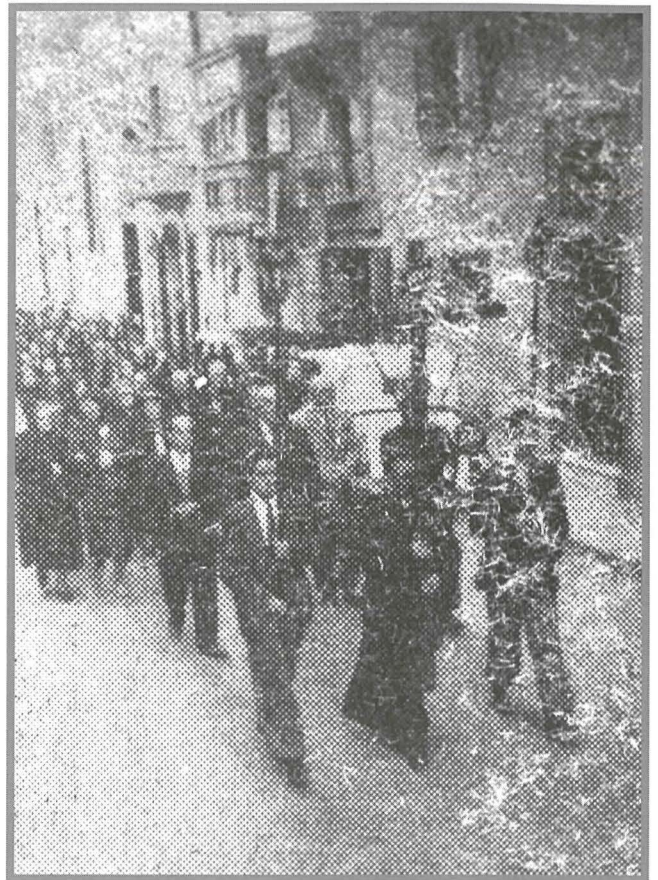
Il-pellegrinaġġ li sar mill-Parroċċa ta' Stella Maris għas-Santwarju.

It-territorju ta' Tas-Sliema inqata' mill-parroċċa ta' Birkirkara f'Diċembru 1878 u sar parroċċa