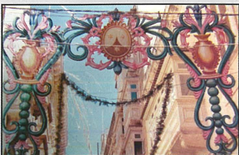
Disinji armati fit-Triq it-Teatru fis-Sebghinijiet.