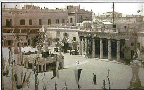
Pjazza San Ġorġ armata għall-festa tal-Karmnu fis-sena 1881, is-sena tal-Inkurunazzjoni. Fuq il-palk tidher il-kolonna u l-anġlu, xogħol Karlu Darmanin li illum għadu jintrama hdejn il-knisja.