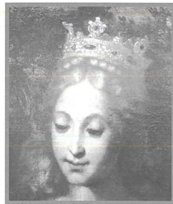
F'Castel Nuovo ġewwa Napli hemm konservata pittura li turi l-Kurċifiss ma' Santa Katerina u San Egidju. Wiċċ Santa Katerina jagħti lemha lil dak tal-Madonna fil-kwadru tal-Madonna tal-Karmnu tagħna. (Ara Footnote 5)

b'devozzjoni l-uċuh ta' Marija u ta' Ġesù li kien fadal. Cf.: Sammut, 36-37.