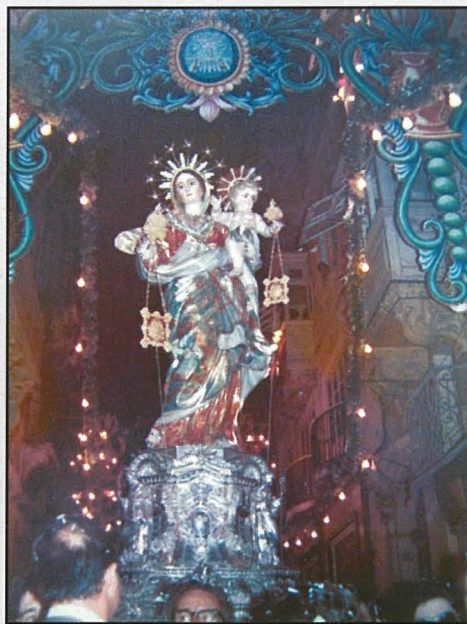
Il-purċissjoni niezla lejn il-knisja.