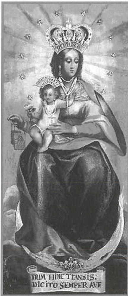
Il-Madonna tad-Dehra f'Pallestrina, Venezja. Hemm xebħ kbir bejn din il-pittura u s-Santwarju tagħna.

Hemm xebħ, l-iktar fil-wiċċ tal-Madonna u fil-qagħda tal-ilbies, bejn il-kwadru li hemm illum u kwadru ieħor interessanti, antik ħafna li jinsab fis-Santwarju tal-Madonna tad-Dehra f'Pallestrina, Venezja. Dal-kwadru laqatni mill-ewwel fix-xebħ tiegħu malli rajtu Venezja. Skont it-tradizzjoni pitru pellegrin fuq tavla ta' bettija tal-inbid bħala radd ta' ħajr lil familja li laqgħetu għandha. Din x-xbieha kellha magħha wkoll impittra fl-istil tas-sacra conversazione lil San Vito u San Modesto, illum maqtughin mix-xbieha tal-Verġni Marija. Hemm min isostni li dal-kwadru hu ta' skola spanjola.