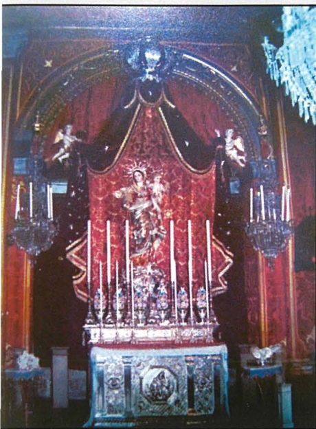
Il-vara tal-Madonna tal-Karmnu armata fil-knisja l-antika għall-festa.