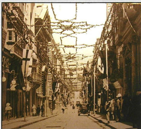
Triq ir-Repubblika armata għall-festa tal-Madonna tal-Karmnu bid-disinji tal-karti.