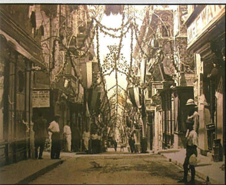
Triq it-Teatru armata għall-festa qabel l-Ewwel Gwerra Dinjija.