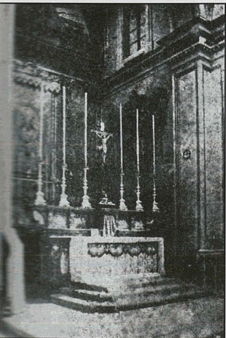
L-artal maġġur li sar fl-1798, li kien hemm fis-Santwarju qabel ma saret it-tribuna. Dan l-artal kien inbiegħ fis-sena 1898 lill-Parroċċa ta' Marija Bambina fil-Mellieħa u għadu hemm sallum.