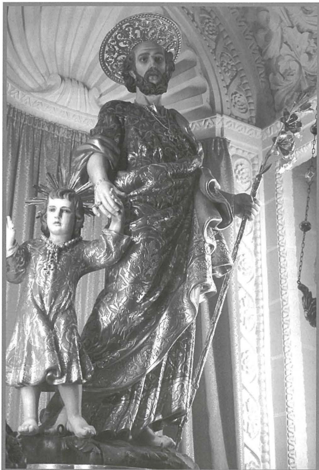
L-istatwa preżenti ta' San Ġużepp xogħol sabiħ fl-injam ta' Ignazio Portelli.

maħluqa fil-pożizzjoni ta' mixi. San Ġużepp jidher jzomm l-id ċkejna ta' Kristu waqt li f'driegħu l-oħra jidher iżomm bastun tal-fidda. Kristu huwa skulturat wieqaf dritt b'id waħda merfugħa 'il fuq waqt li jbierek il-folla li tingemma quddiemu.