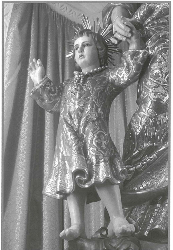
Il-Bambin qiegħed izomm idejn San Ġużepp, sinjal ta' sigurtà u fiduċja f'San Ġużepp il-Missier Putattiv.

Fis-sena 1952, din it-tieni statwa ta' San Ġużepp kienet tinsab f'niċċa fil-Knisja, sewwa sew faċċata tan-niċċa li fiha kienet tinzamm l-istatwa tal-Madonna tal-Karmnu. Fatt