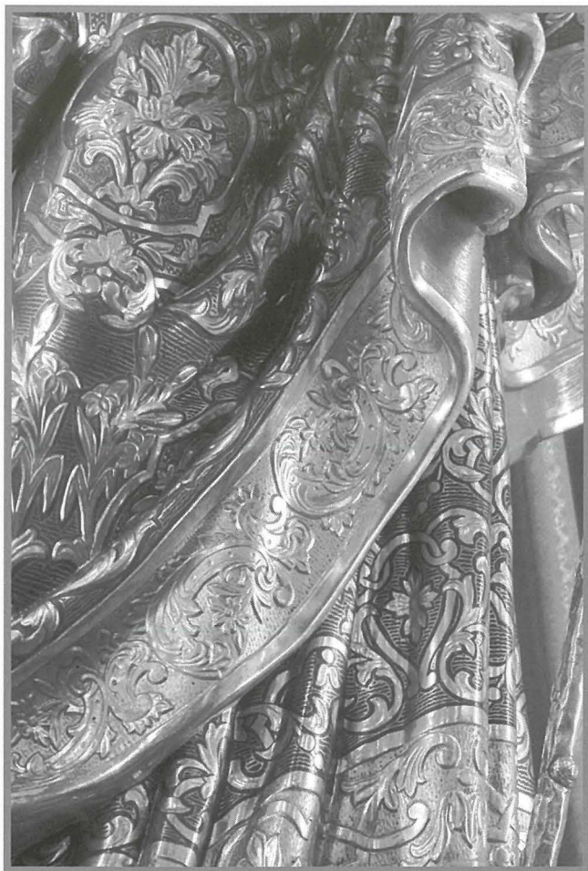
Detall li juri s-sbuhija tal-panneġġar f'din l-istatwa kif ukoll l-induratura sabiha li fiha.

interessanti huwa li l-istatwa ta' San Ġużepp mhux minn dejjem kienet tokkupa postha fil-Knisja. Skont riċerka arkivjali tirriżulta li sas-sena 1933 7 , fin-niċċa ta' San Ġużepp kienet tinzamm l-istatwa tal-Anglu Kustodju. Dan nafuh għax fit-2 t'Ottubru tas-sena 1933, il-fratellanza ta' San Ġużepp talbet lill-Komunità Karmelitana biex l-istatwa tal-Anglu Kustodju timxi għall-Oratorju ta' San Ġużepp. Fil-preżent, l-istatwa tokkupa post fin-niċċa vicin il-bieb prinċipali tal-Knisja.