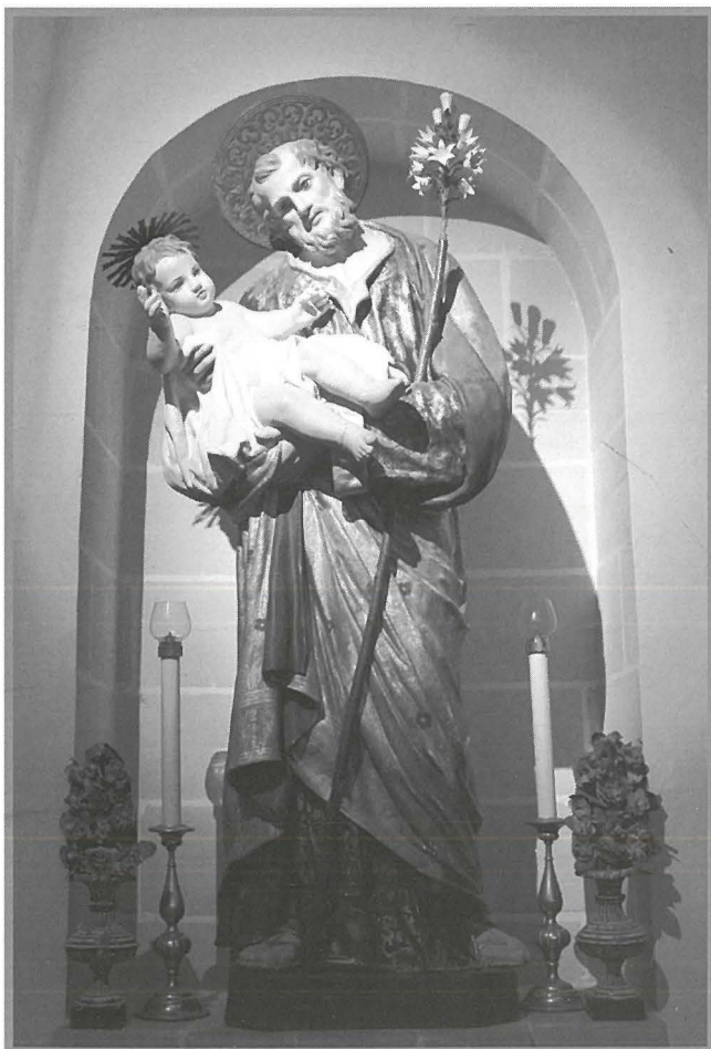
L-ewwel statwa tal-Konfraternità ta' San Ġużepp tal-Belt Valletta.

L-ewwel statwa ta' San Ġużepp tmur lura għas-seklu sbatax minn skultur mhux magħruf. Din il-biċċa xogħol artistika ǵiet mibjugħa għall-prezz ta' 1700. skud 4 . Ta' min isemmi dan il-bejgħ sar meta l-Fratellanza kellha bħala prokuraturi lil Gio Batta Chircop u Domenico Dingli 5 .