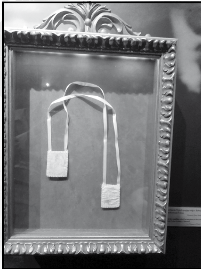
Labtu li kien jilbes il-Papa Gwanni Pawlu II miżmum b'għożża f'mużew fil-Polonja

Huwa kiteb 14-il enċiklika fosthom Ecclesia de Eucharstia , Redemptoris Mater , Fides et Ratio , Veritatis Splendor , u Evangelium Vitae . Huwa miet fit-2 ta' April 2005 fl-età ta' 84 sena u sar qaddis wara disa' snin biss. Il-labtu tal-Karmnu dejjem żammu fuqu fejn il-Madonna ħelsitu