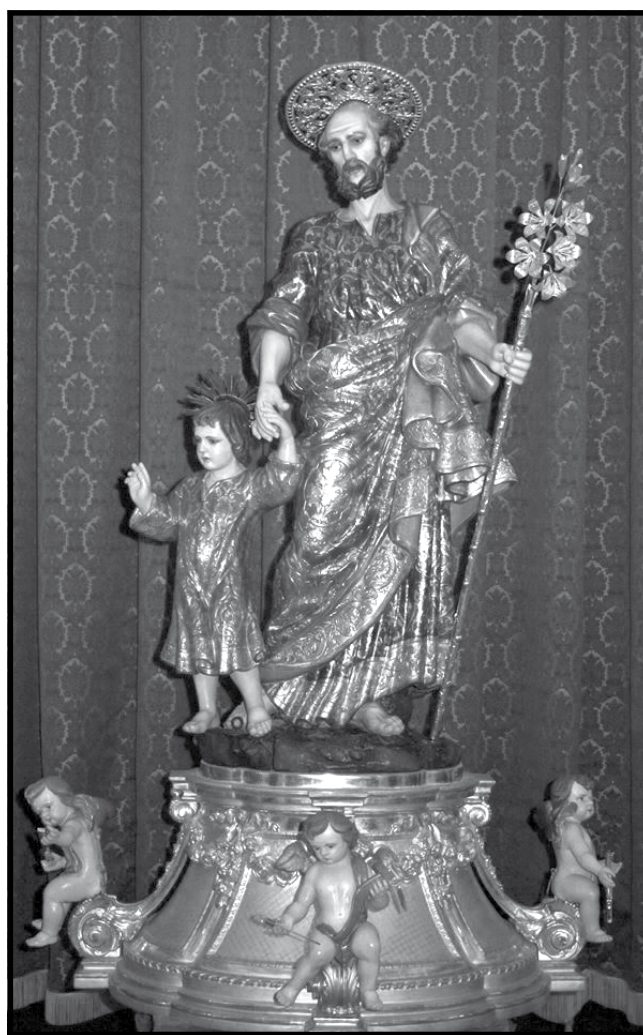
L-Istatwa ta' San Ġużepp meqjuma b'għożza fis-Santwarju tal-Madonna tal-Karmnu fil-Belt Valletta

Hames snin ilu kont ktibt f'din l-istess publikazzjoni, artiklu dwar id-devozzjoni ta' San Ġużepp kif imxandra mill-Ordni tal-Karmelu. 1 Konna għidna li saħansitra hemm kitbiet medjevali li jirrakonta kif Marija u Ġużeppi kienu jżuru xi eremiti fuq il-muntanja magħrufa bħala "tal-Karmelu". Lil hinn mil-leggendi sibna li Healy Thompson (1980) 2 jistqarr li l-Ordni Karmelitan "impurtaw għall-ewwel darba mil-Lvant għall-Punent il-prattika lodevoli li tagħti l-ogħla kult lil San Ġużepp". Nafu li kienu huma l-ewwel fl-Ewropa li onoraw lil San Ġużepp b'uffiċċju speċjali tat-Talb. Fl-imsemmi artiklu għidna wkoll li l-Kapitlu Ġenerali tal-Ordni Karmelitan, approva unanimament l-għażla ta' San Ġużepp bħala l-Protettur Primarju tal-Ordni. Ir-rabta bejn l-Ordni Karmelitan u San Ġużepp kompliet tissaħħaħ permezz tal-qaddisa kbira tiegħu Santa Tereza ta' Avila. Chorpenning, J. F. (1993) juri li: huwa fatt li ma tistax tmerih li l-Karmelitani, partikolarment fil-persuna ta' Santa Tereza ta' Avila, taw kontribut magġuri għat-tixrid tal-venerazzjoni ta' San Ġużepp fl-Ewropa Moderna tal-Bidu. 3 Jerònimo Graciàn de la Madre de Dios (1564-1614) patri Spanjol li ta kontribut importanti għall-istudji Josefologiċi permezz tal-ktieb tiegħu Summary of the Excellencies of St Joseph , ippublikat fl-1597, kiteb dwar dan fl-imsemmi ktieb, fejn iddedika kważi kapitlu shih. 4 Hawnehkk