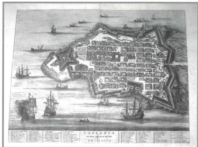
Pjanta tal-Belt il-Ġdida – Valletta

Dumnikani, Agostinjani u Franġiskani – hassew id-dmir li jagħtu daqqa t'id u kollha hasbu sa mill-bidu biex jittfġhu saqajhom fil-Belt il-Ġdida.