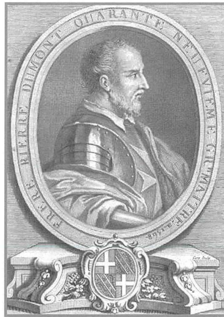
Pietro Del Monte - Il-Gran Mastru li fi żmienu ntrax l-art