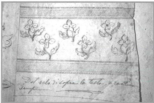
Disinn tal-induratura originali tal-vara tal-Madonna tal-Karmnu

Marija tal-Karmnu l-Belt Valletta qabel ir-rinnovament tal-istess statwa.) Filwaqt li naraw ammont ta' ward u weraq flimkien mill-istess zokk u taht miktub "Dal manto e continua" (mill-mant u jkompli) (Fig. 1). Minn dan jidher li l-mant kien mimli fjuri imma minghajr bordura jew panew. It-tieni parti tad-disinn wiehed isib miktub "Dal velo di sopra la testa e continua sempre" (mill-velu ta' fuq rasha u jibqa' ghaddej dejjem). (Fig. 2) Hawnhekk id-disinn juri fjuri zgħar b'bordura hoxna fuq u isfel.