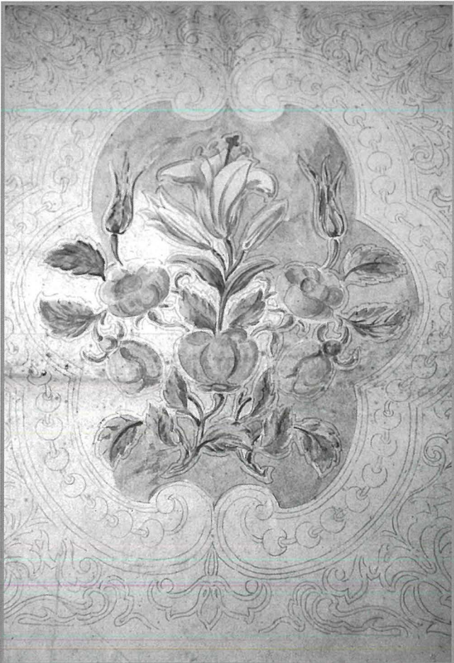
Disinn ta' parti mill-induratura prezenti