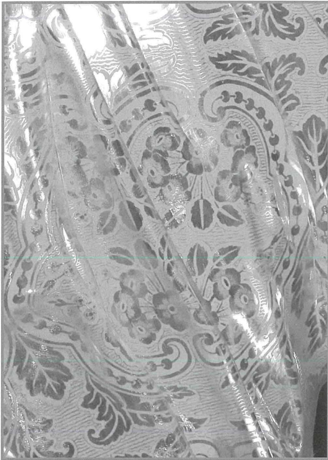
Dettall mill-induratura tal-istatwa ta' San Pawl