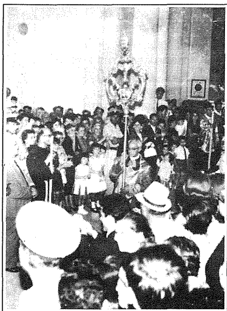
Tintinnablu ħiereġ mill-Bażilika Minuri tan-Nadur.