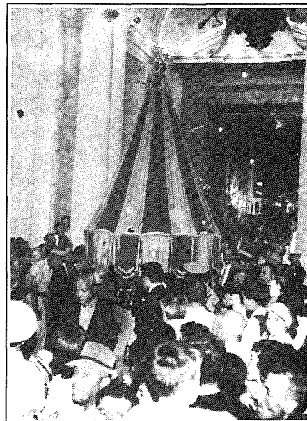
Umbrellun Bażilikali ħiereġ mill-kollegjata Bażilika Minuri ta' S. Pietru u S. Pawl, Nadur, Għawdex.

Iżda Umbrellun Bażilikali jrid ikun isfar u aħmar biex juri li dik il-Bażilika hija bħal dik ta' Ruma u jrid ikollu arma wahda biss tal-Papa, ta' dak li ta l-privileġġ.