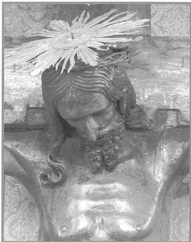
Il-Kurċifiss li qabel kien fuq l-artal tas-Sagrament minflok il-pittura li hemm illum.