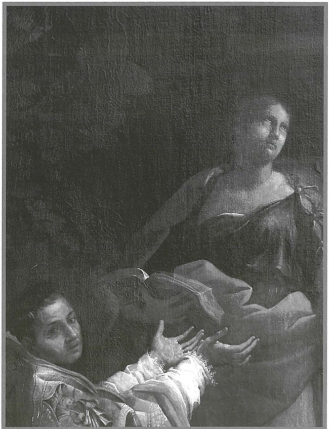
Detall mill-pittura fejn jidhru x-xbihat ta' Sant'Andrija Corsini u Sant'Agnese.

Nafu żgur li fl-Italja, żewġ xoghlijiet ta' fama internazzjonali li jirrapreżentaw li Sant'Andrija Corsini ġew impittra minn Reni. F'wieħed mill-pitturi li qiegħed f'Palazzo Corsini