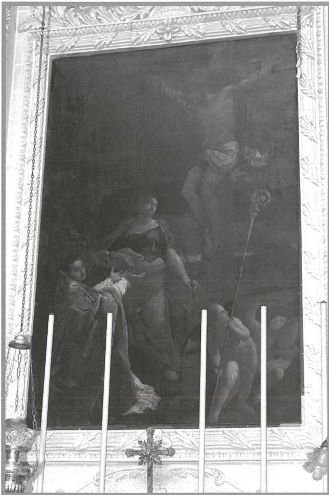
Il-kwadru tal-Kurċifiss, xogħol mill-isbaħ tas-Seklu Sbatax.

L-ewwel impressjoni li wieħed jiehu meta jara din il-pittura impressjonanti ta' Kristu Msallab, hija li l-kompożizzjoni maħsuba mhix simetrika bhalma huma l-aktar maghrufa fix-xogħlijiet reliġjużi ta' Guido Reni. Ta' min isemmi każ klassiku ta' simetrija eċċezzjonali, il-pittura tar-rappreżentazzjoni ta' Kristu Msallab li Reni kien pittur fis-sena 1619 speċifikament għall-knisja tal-Kappuċċini. Illum din il-pittura ta'