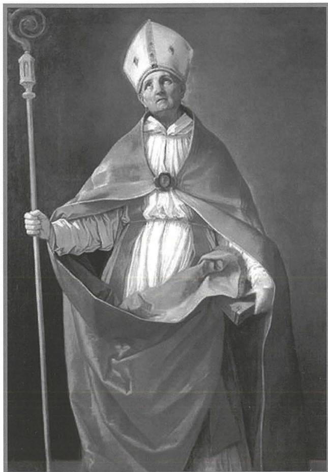
Pittura li tirrappreżenta lil Sant'Andrija Corsini xogħol Guido Reni. Din tinsab fil-Pinacoteca Nazionale f'Bologna.

f'Firenze ta' circa 1628-1630, l-Isqof qaddis huwa rrapprezentat qed jiġi meġġun minn żewġ anġli bħalma hemm fil-kompożizzjoni fil-pittura ta' Malta. It-tieni pittura ta' Reni ta' Sant' Andrija Corsini tinsab fil-Pinacoteca Nazionale f'Bologna hu xogħol aktar tardiv.