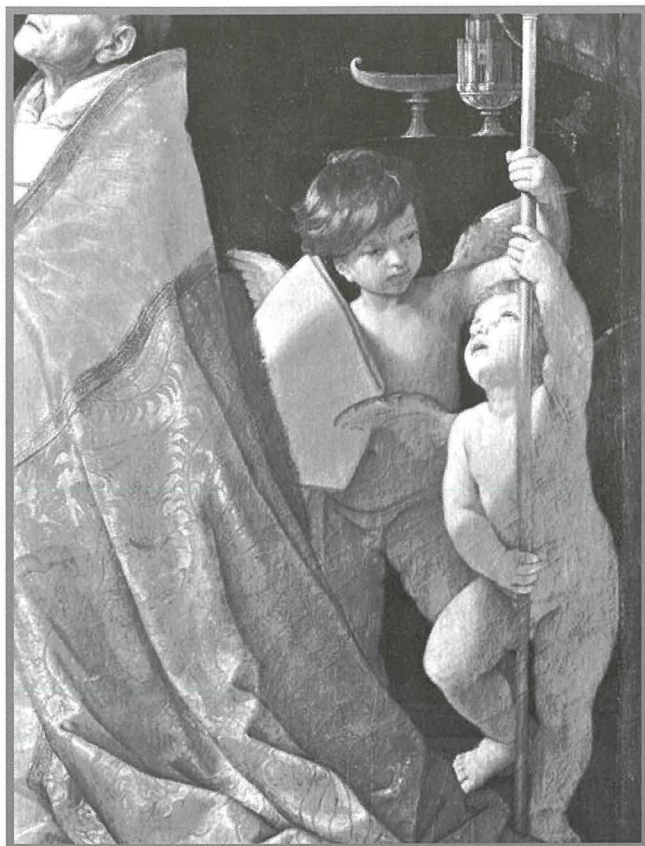
Żewg anġli bis-simboli tal-qaddis Sant'Andrija Corsini xogħol ta' Guido Reni, simili hafna għall-dawk li nsibu fil-pittura li qiegħda fis-Santwarju.