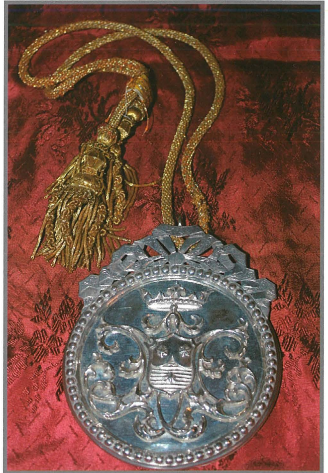
Il-Medaljun li qed jintuża illum mir-Rettur.

Hemm hafna konfratelli imnizzlin b'isimhom, u l-biċċa l-kbira kienu nies li ma baqgħux jissemmew fl-istorja. Ftit huma dawk li nafu x'kienet is-sengħa jew il-professjoni tagħhom, jew fejn kienu joqogħdu (wiehed imnizzel li kellu żewġ ikmamar quddiem il-funtana tal-