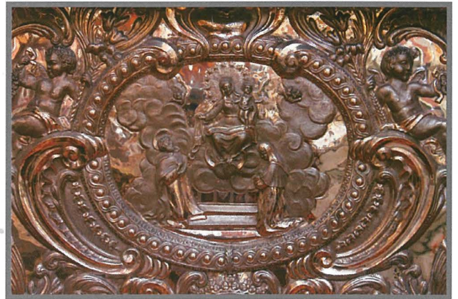
Dettall tal-ventartal tal-fidda li jintrama fuq l-artal tas-Sagrament.

Imma l-fratelli tal-Karmnu kienu anke jużaw xi flus li jdaħħlu mill-proprjetà, mill-investimenti u mill-miżati, għall-benefikati u tiżjin tal-oratorju u tal-knisja tal-Karmnu. Hekk, fit-27 ta' Settembru 1772 huma irregalaw qanpiena ġdida lill-kunvent, bil-kundizzjoni li l-patrijiet kellhom idoqquha, flimkien maż-żewġ qniepen minuri, fl-ottava tad-dfin ta' fratell u f'kull funzjoni tal-fratellanza. Fl-1808 ġie awtorizzat il-hlas tal-ornamenti u bieb tar-ram tat-tabernaklu tal-artal il-ġdid tal-irħam maħdum minn Mastru Cardona għall-oratorju. Fl-1812 tħallas kurċifiss tal-fidda ġdid. Ftit wara, il-fratelli ivvutaw li jagħmlu ventartal tal-fidda, u xtraw il-linef tal-kristall, bin-nofs mal-patrijiet. Fl-1838 sar l-istandard il-ġdid, u fis-sena ta' wara ġie imsewwi l-orgni. Fil-1852 huma ordnaw l-Via Crucis minn Ruma.