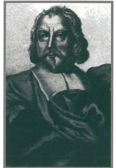
Nicholas Cottoner, li kien Granmastru tal-Ordni ta' San Ġwann bejn l-1663 u l-1680. Flimkien ma' huh, Raphael Cottoner, li kien ukoll Granmastru bejn l-1660 u l-1663, kienu Konfratelli fil-Konfraternità tal-Madonna tal-Karmnu tal-Belt.

Mandraġġ). Xi kavallieri ukoll issieħbu fil-Konfraternità: fosthom xi uħud famużi sew, bħall-aħwa Raphael u Nicholas Cottoner li wara t-tnejn laħqu Gran Mastri, u l-Bali Pinto u Pappalardo. Il-fratelli ma kinux kollha Maltin: fil-1703 jissemma Tommaso Rutter li kien Inġliż, u Carlo Bordon 'di nazione Francese' fl-1720. Fost l-ismijiet aktarx magħrufin insibu lil Cesare Passalacqua, l-ewwel Baruni ta' Budaq, sinjur u benefattur kbir, rettur fl-1684,