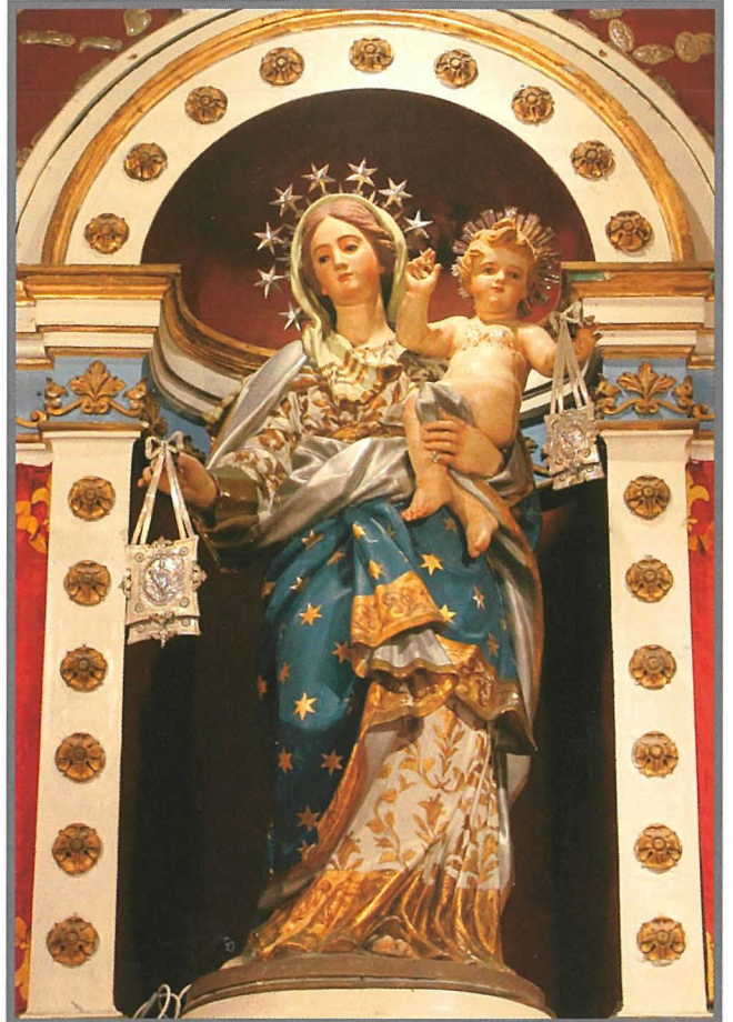
L-ewwel statwa tal-Madonna tal-Karmnu li saret mill-Fratellanza. Din l-istatwa kienet tintuża f'jum il-Festa tal-Madonna tal-Karmnu, fl-ottava u kull meta jsiru purċissjonijiet biex tagħmel ix-xita.