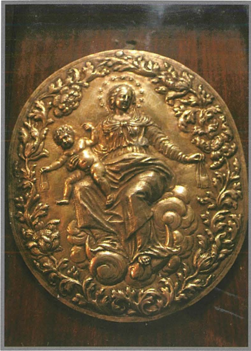
Il-Medaljun l-antik li kien jintlibes mir-Rettur f'purċissjonijiet u ċelebrazzjonijiet solenni.

bil-konfratelli". Din kienet l-ewwel fratellanza marbuta mal-knisja tal-Karmnu. Warajha ġew dawk ta' San Ġużepp, imwaqqfa tnaħ-il sena aktar tard, fil-5 ta' April 1634, imbagħad tal-Anġlu Kustodju, fl-1760, u tal-Beatu Franco, eretta fit-3 ta' Marzu 1806. 2