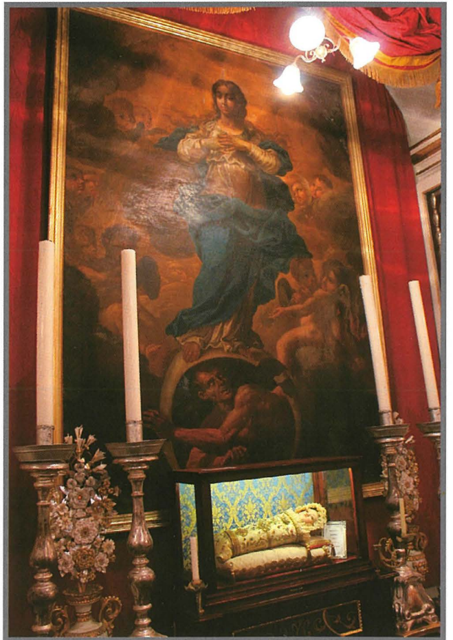
Il-Kwadru tal-Kunċizzjoni li kien jinsab fis-saqaf tal-Oratorju preżenti.

Il-kliem ta’ din l-iskriżzjoni, illum mitlufa, huma fost l-isbaħ li qatt qrajt.