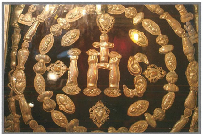
Ex-voti tal-fidda li jiksu l-hitan ta' dan l-Oratorju