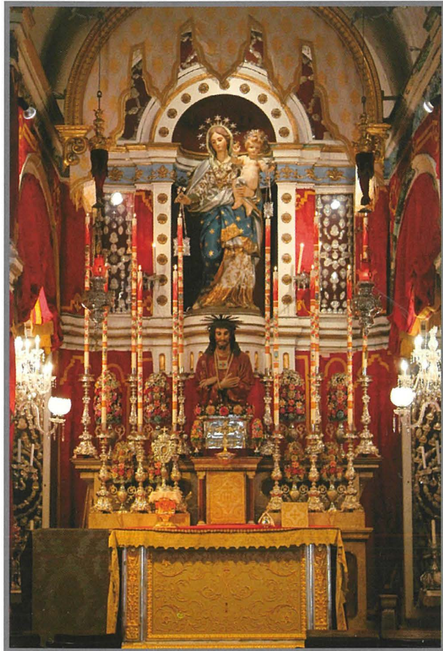
L-Oratorju preżent, xhieda haġja tad-devozzjoni u l-imħabba li l-Konfraternità dejjem kellha lejn il-Madonna tal-Karmnu.

"L-oratorju huwa sabiħ ferm imħabba l-iskultura u l-induraturi li fih; it-tul huwa ta' sitt braccia u erba' palmi , u l-wisgħa ta' tliet braccia u żewġ palmi , qiesien ta' Malta, inkluż il-presbiterju. Fil-prospett hemm in-niċċa bl-istatwa tal-injam indurata magħmula a spejjeż tal-Konfraternità ċirka s-sena 1735. Din l-istatwa titneħħa minn dan il-post u tittiehed fil-purċissjoni f'jum il-festa tal-Imqaddsa Verġni tal-Karmnu, fl-ottava, u kull meta jsiru il-purċissjonijiet biex tagħmel ix-xita.