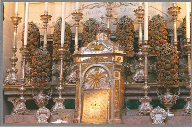
L-Artal tas-Sagrament armat fil-festa bil-gandlieri u fjuretti tal-Konfraternità tal-Madonna tal-Karmnu.