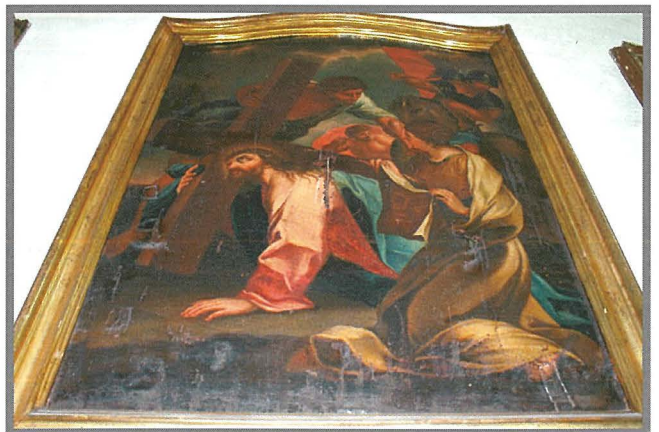
Inkwatri tal-Passjoni mogħtija minn numru ta' fratelli.