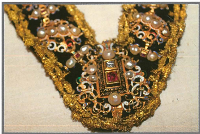
l-Ċintill ta’ Passalacqua li jissemma fl-inventarju tal-1774.

Fit-13 ta’ Frar 1822, il-Konfraternità għalget mitejn sena haġġa, u saru ċelebrazzjonijiet kbar; tqassmu 300 hobża lill-fqar, tpoggiet mixghela fuq il-faċċata tal-knisja, u skrizzjoni miktuba mill-Latinist rinomat Abate Don Luigi Rigord. “Il-knisja ġiet imzejna pomposamente bid-damask u l-linef”, il-vara u s-Sagrament ġew esposti fuq l-altar maġġur, imzejjen b’ 96 xemgħa mixgħulin, u saret quddiesa kantata bil-paneġirku bil-Malti mill-Kanonku Dun Paul Cauchi. Xi festi esterni kellhom jithassru mħabba l-maltemp.