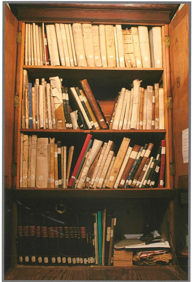
Parti mill-arkivju li għandha l-Konfraternità tal-Madonna tal-Karmnu tal-Belt.

dawn l-arkivji għadhom jeżistu, u jekk huwa hekk jisthoqqilhom li jiġu preservati sew u jsiru l-oġġett ta' studju estensiv u speċjalizzat, wisq oltri minn dawn il-ftit notamenti li qed noffri illum. Jistgħu jkunu minjiera mhiex esplorata ta' tagħrif storiku, soċjali, demografiku, reliġjuż u artistiku.