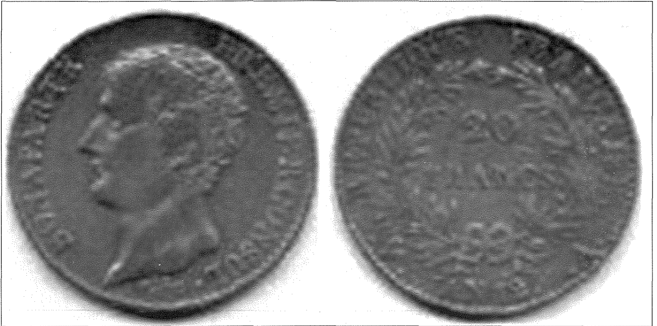
Il-munita Napuljun ta' valur 20 franc. Quddiem u wara.

tiegħu f'għalqa msejha Ta' Jannar. Izda meta rritorna sabiex jitlaq lura wara l-festa, huwa sab il-ħmar kważi żarmat! Sab neqsin it-testiera, żewġ biċċiet tal-ġilda u gummiena dekorattiva li flimkien kienu jiswew tliet xelini. Huwa ma jissuspetta f'ħadd.