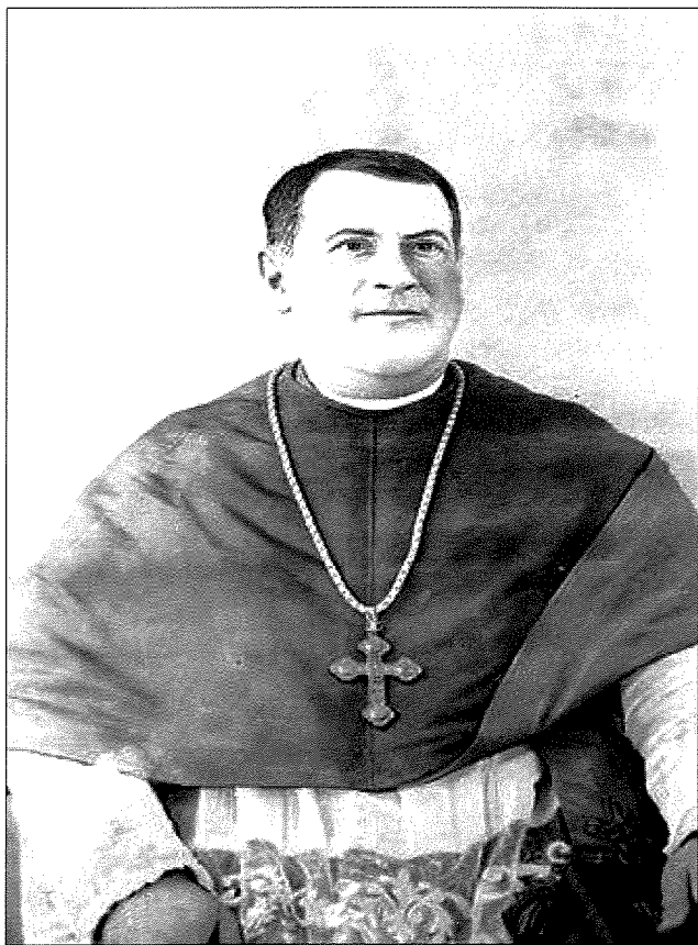
Il-Kanonku Dun Angelo Bajada.

lżda l-istorja ma waqfitx hawn. L-għada, fl-10.30 ta' filgħaxija, l-imsemmi Said kien imħarrek talli fil-jum ta' qabel, madwar il-hin tal-10.30 ta' filgħaxija, ġarr arma regolari (aktarx l-istess pistola inkwistjoni) mingħajr il-liċenzja tal-pulizija u talli ħalliha f'idejn