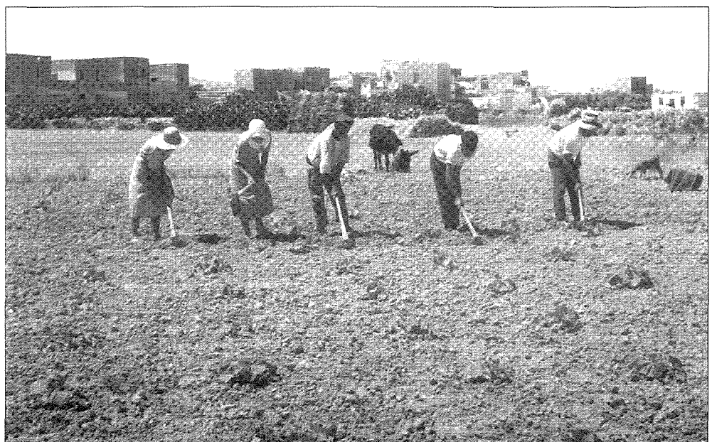
Bdiewa jagħzqu r-raba'.