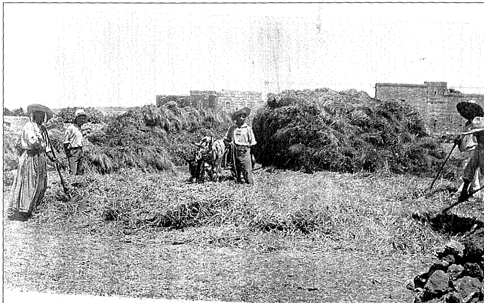
Dris fuq il-qiegħa.

• Fis-6 ta' Lulju, fit-3 ta' filgħaxija, Ġuzeppi Grech ta' 20 sena iben Ġuzeppi ta' 75 Triq it-Tigrija, irraporta li Ġuzeppi Portelli ta' 25 sena iben Wiġi ta' 3 Triq it-Tigrija, daħal fid-dar tiegħu billi xxabbat ma' ħajt tas-sejjeħ mingħajr il-kunsens tiegħu u insulentah.