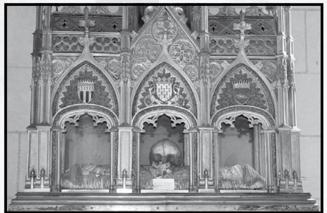
Il-Fdalijiet tal-Beata Franġiska d'Amboise