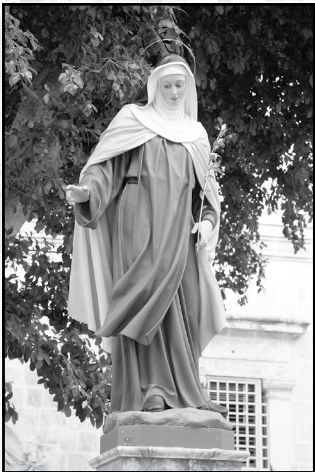
L-istatwa tal-Beata Ġwanna Scopelli li tintrama għal festa tal-Madonna tal-Karmnu fil-Belt

Twieldet f'Reggio Emilia probabbilment fl-1428, ftit li xejn nafu fuq l-ewwel snin ta' hajjitha. Il-vokazzjoni religjuża mill-ewwel uriet ruħha f'qalbha, u l-ġenituri tagħha Simone u Caterina hallewha ssir mantellata Karmelitana. Baqgħet tgħix id-dar u ddedikat ruħha għaż-żewġ ħutha bniet u ħuha. Wara l-mewt tal-ġenituri tagħha, giet milqugħa minn mara ta' kundizzjoni umli, imma sinjura fil-pjetà. Ġwanna baqgħet tfittex post biex tadattah f'monasteru. Wahda armla offriet lilha nnifisha, liż-żewġ uliedha u d-dar tagħha għal dan l-iskop. Għexu flimkien f'dak il-post bejn l-1480 u l-1484, filwaqt li kompliet tfittex post adattat għall-monasteru. Fl-1845 bl-għajnuna tal-Isqof Filippo Zoboli, akkwistat il-Knisja ta' San Bernard li kienet tal-Patrijiet Umiliati, li talbitha lill-Ġeneral tagħhom, waqt li kien għaddej minn Reggio. Il-monasteru l-gdid ingħata l-isem ta' Santa Maria del Popolo