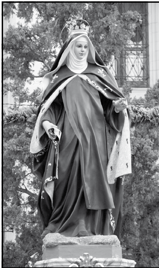
L-istatwa tal-Beata Frangiska D'Amboise li tintrama quddiem il-qorti għall-festa tal-Madonna tal-Karmnu fil-Belt

Frangiska twieldet fit-28 ta' Settembru 1427, bint Luigi, l-Viskonti ta' Thouars u Maria ta' Rieux tal-Baruni d'Encenis. Fl-età tenera ta' kważi erba' snin giet imwegħda bħala għarusa lil Pietru II, it-tieni wild tad-Duka tal-Brettanja u marret toqgħod mal-kunjata futura tagħha Giovanna, oħt ir-Re ta' Franza Karlu VII. Din il-mara li kienet religjuża ħafna, kellha x-xorti li tiltaqa' ma' San Vincenz Ferrer, u għaddiet liċ-ċkejtna Frangiska spiritu nisrani profund. Minkejja li kienet tgħix qalb il-pompa u l-lussu, xorta kienet thoss f'qalbha x-xewqa li tfittex permezz tat-talb l-għaqda sħiħa ma' Alla. Kif kien previst iżżewġet fl-età ta' ħmistax-il sena, żewġha kien ġa tilef lil missieru u lil ħuh il-kbir. Fl-1450 fil-Katidral ta' Rhemis saret iċ-ċelebrazzjoni tal-Inkurunazzjoni. Iż-żewġ miżżewġin, f'sintonija ammirabbli, dejjem kienu mbuttati lejn il-bżonnijiet dejjem aktar gravi tal-poplu u kienet ukoll kbira l-attenzjoni lejn il-knejjes u l-monasteri. Fl-ewwel sena taż-żwieġ, anke biex jirribattu ċerti problemi, għamlu pellegrinaġġ biex jitolbu l-protezzjoni tal-Vergni Marija. Frangiska kellha influżż pożittiv