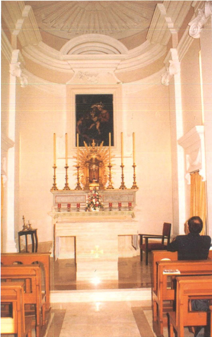
Il-Knisja tal-Madonna tal-Grazzja minn ġewwa

Memorji sbieh iġhaddu minn moħħi meta nidħol fil-knisja ż-żghira. Din il-Knisja ċkejna imma ta' storja kbira, tinsab fuq in-naħa l-oħra tal-Knisja Arcipretali u Matrici taġħna Stella Maris.