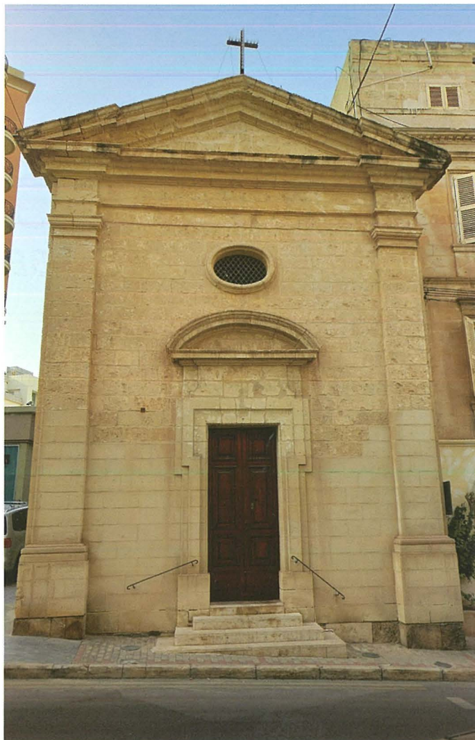
Il-faċċata tal-Knisja ż-żgħira

Għalkemm illum m'għadux issir dak li irrakkuntajt jien, xorta waħda l-Knisja ż-Żgħira għad għandha skop qaddis, għax ikun hemm Ġesu Sagramentat