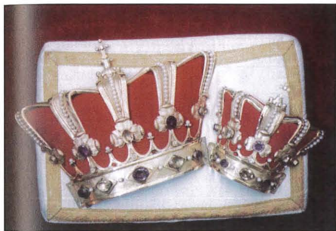
Iż-żewġ kuruni li mill-1881 komplew sawru dan l-inkwadru mirakuluż

Sa minn filgħodu kmieni, il-knisja kienet diġa maħnuqa bin-nies jistennew il-ħin ta l-Inkurunazzjoni. Fis-sitta ta' filgħodu għalhekk beda il-kant ta' "Prima" akkompjanjat mill-orgni. Waqt il-kant tal-Martiroloġju, waqt li l-Patrijiet Karmelitani kienu kollha fil-Kor taħt ix-xbieha tal-Madonna tal-Karmnu, tħabbret is-Solennita' tal-Festa tal-Madonna tal-Karmnu.