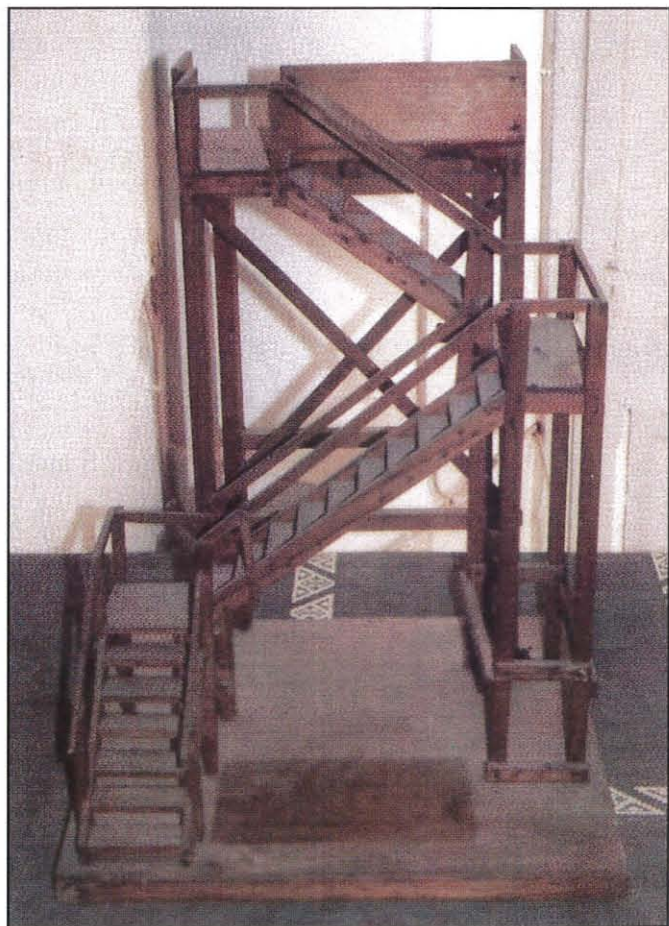
Il-palk li sar apposta għall-okkazzjoni biex ikunu jistghu jitpoġġew il-kuruni fuq l-inkwadru