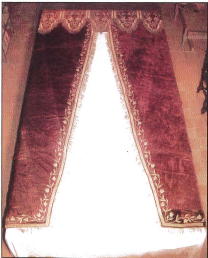
Il-Putiera tas-Santwarju li kienet intużat waqt l-Inkurunazzjoni fl-1881

It-tieni u t-tielet jum tat-Tridu solenni, jiġifieri t-13 u l-14 ta' Lulju, saru bl-istess pompa. Fit-tieni jum sar Pontifikal Mill-Eċċellenza Tiegħu Revma. Monsinjur Pietru Pace, Isqof ta' Għawdex. Kien assistit minn żewġ Kanonċi tal-Kollegjata ta'