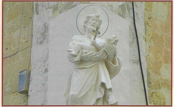
L-istatwa ta' San Ġuzepp wara r-restawr

fjuri kienu tpoġġew f'waħda minn idejhom. B'hekk l-istatwa saret tissimbolizza l-purità u tixbah lill-Madonna tal-Ġilju. Madankollu, ħafna nies anzjani mil-lokal kienu jafu din l-istatwa bħala Maria Regina u kien deċiż li aħjar li jinżamm dan it-titlu. Għalkemm matul is-snin l-istatwa kienet miżbugħa bajda, testijiet polikromiċi wrew traċċi ta' lwien differenti ta' żebgħa kannella, li setgħu jattribwixxu li oriġinarjament, l-istatwa kienet miżbugħa bil-kuluri tal-Karmelitani, kannella ċar u skur. Għaldaqstant, din l-istatwa reġgħat giet misbugħa b'dawn il-kuluri.