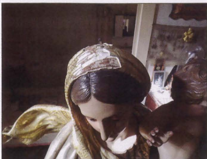
Il-velu tal-Madonna waqt ir-restawr