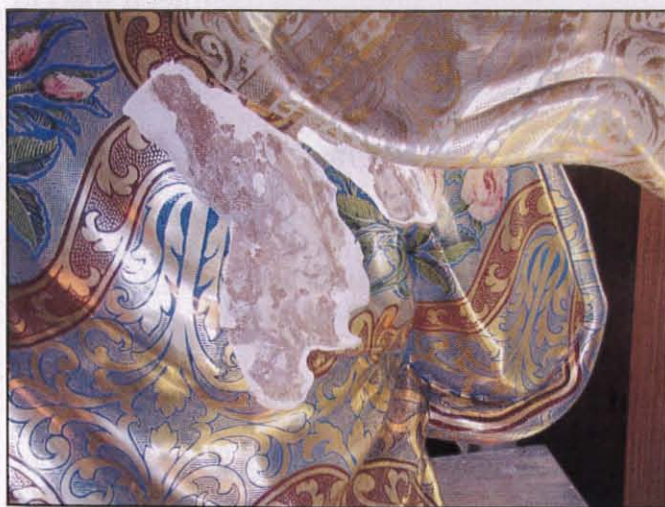
Wiehed mill-aktar postijiet li kellu bżonn ir-restawr (fuq dahar il-Madonna)

Pullu spjegalna wkoll il-proċess kollu li għamel matul ir-restawr tal-vara, fejn l-ewwel proċess kien li jaqla l-biċċiet tal-ġibs, jittrimjahom, imbagħad wara diversi testijiet beda jaqiegħdom lura f'posthom. Il-vara f'partijiet minnha nsibu fiha, ġonot ta' injam, fejn f'dan il-każ meta l-induratur jiġi biex ipogġi fuq il-partijiet tal-ġonot, biex