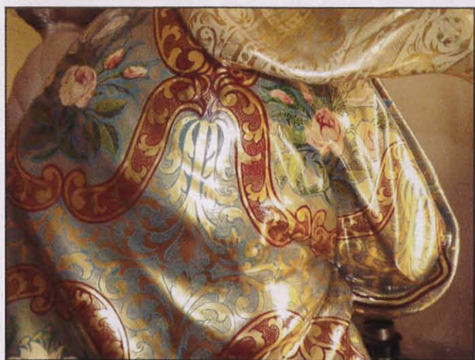
L-istess post kif inhu lest wara x-xogħol tar-restawr