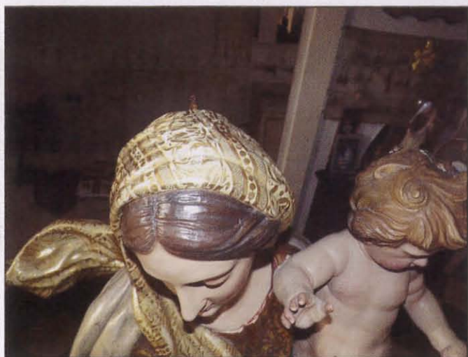
Il-velu lest wara x-xogħol tar-restawr

ma sar kienu tesitjiet tal-umditu' u t-temperatura li kien hemm fin-niċċa, dan biex jiġi konfermat minn fejn kienet ġejja l-ħsara. Kif ġew konfermati r-riżultati ta' dawn it-testijiet wiehed seta jkun jaf x'tip ta' restawr ried isir.