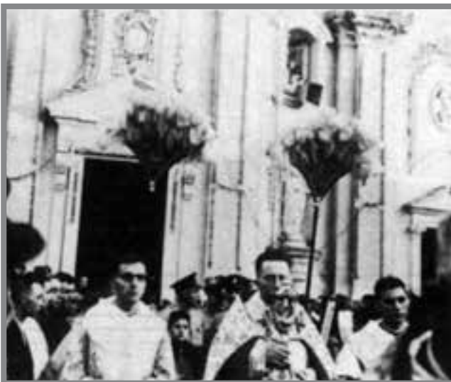
Festa tal-Bażilika ta' San Ġwann Battista fix-Xewkija, Għawdex

Darba'oħra kienet ħadet sehem fil-Festa tal-Madonna tal-Karmnu tal-Gżira kif ukoll fil-Festa tal-Madonna tal-Karmnu fiż-Żurrieq.