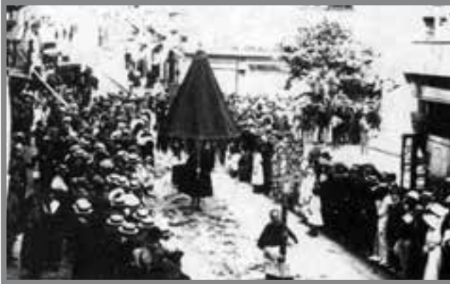
1917 Solennità tal-Ġisem u d-Demm tal-Mulej. Purċissjoni li tohroġ mill-Kon-Katidral ta' San Ġwann, Valletta

kemm-il darba imma meta s-Santwarju nġhata t-titlu ta' Bażilika Minuri dawk aktar żdiedu. Fl-1921 il-komunità ġiet mistiedna f' Birkirkara fiċ-Ċentinarju ta' Sant'Elena u ġiet mogħtija l-preċedenza bħala Santwarju Bażilika.