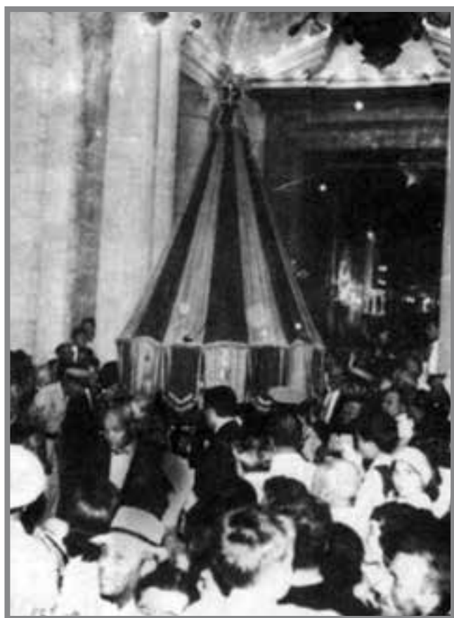
Umbrellun Bażilikali ħiereg mill-Kollegġjata Bażilika Minuri ta' S. Pietru u S. Pawl, Nadur, Għawdex

Din is-sena qed niċcelebraw il-120 sena minn meta s-Santwarju tal-Madonna tal-Karmnu ngħata t-titlu ta' Bażilika Minuri mill-Papa Ljun XIII fit-13 ta' Mejju 1895. Din kienet l-ewwel darba li knisja f'Malta ngħata dan it-titlu bil-privileġgi kollha.