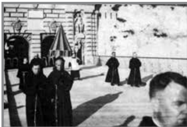
Kungress Ewkaristiku 1938

L-Umbrellun Bażilikalijiet u t-Tintinnablu kienu jiehdu sehem ukoll fil-festi ta' San Pawl