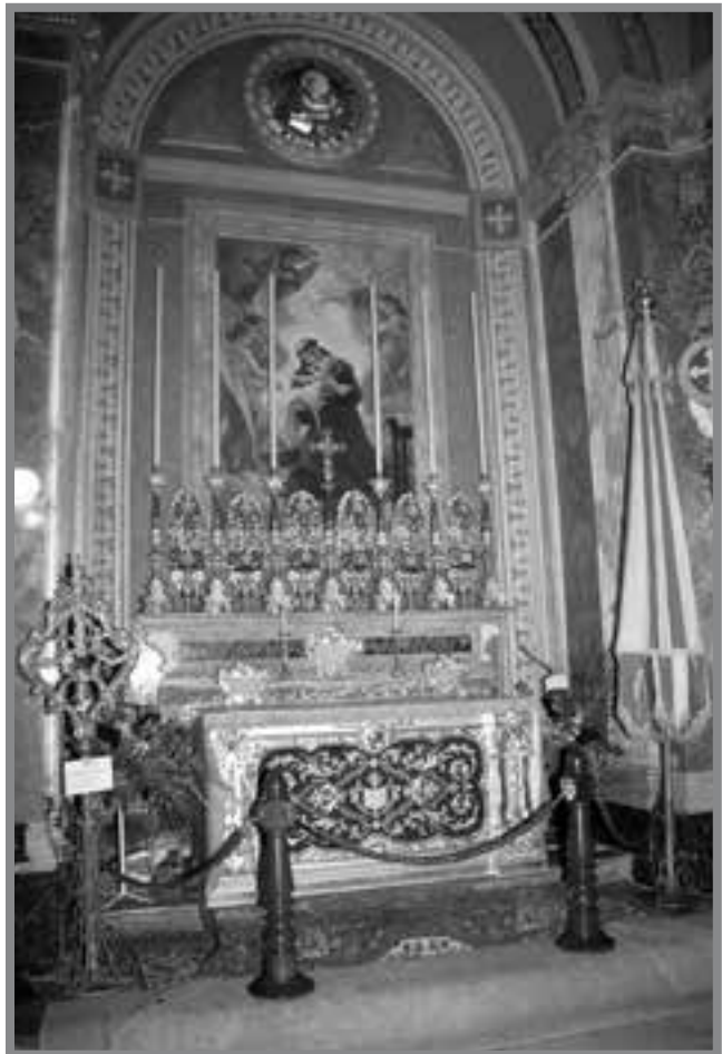
L-Insinji bażilikalni tax-Xagħra armati ġewwa n-Nadur fl-istess okkażjoni