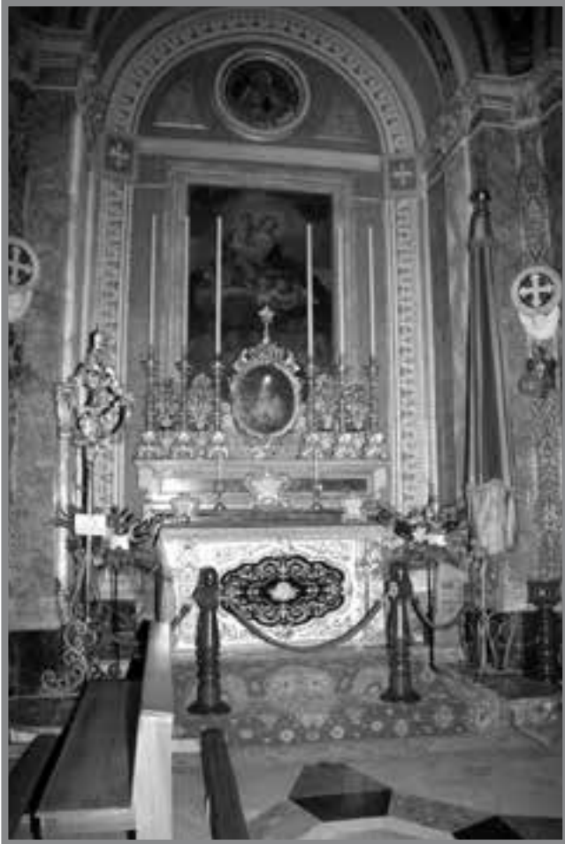
L-umbrellun u t-tintinablu tal-Karmnu armati fil-knisja tan-Nadur