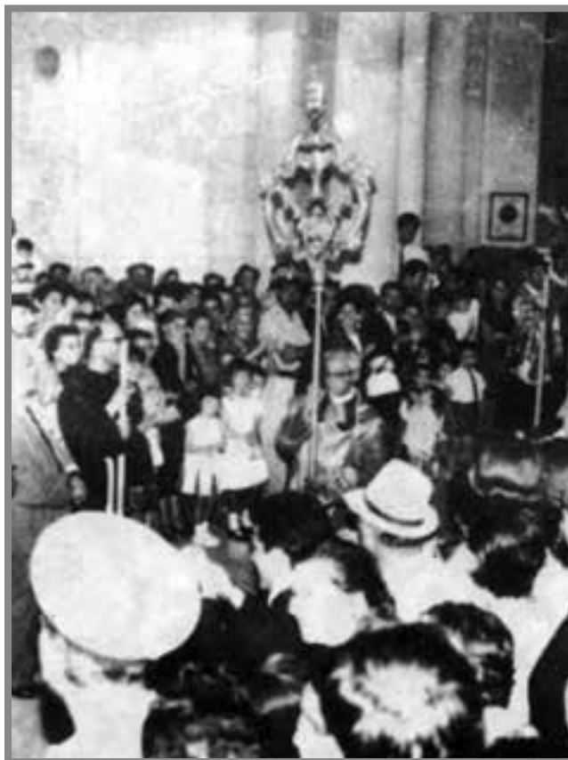
It-Tintinnablu ħiereg mill-Bażilika Minuri tan-Nadur