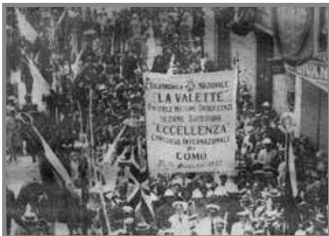
Il-Banda La Valette qed tagħmel is-servizz tagħha nhar il-15 ta' Lulju

Xatt ta' Tas-Sliema u jibqgħu sejrin sa Ta' Xbiex. Ir-rebbieħ tal-tigrijiet kien jingħata l-palju tradizzjonali li kien jirregalah lill-Knisja tal-Madonna tal-Karmnu tal-Belt Valletta. Id-drapp ta' kull palju kien jintuża biex isiru paramenti sagri.