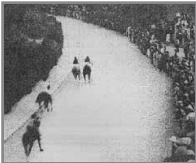
It-Tigrijiet taż-żwiemel li jkunu jsiru fl-okkażjoni tal-Festa tal-Madonna tal-Karmnu minn tas-Sliema sa Ta' Xbiex