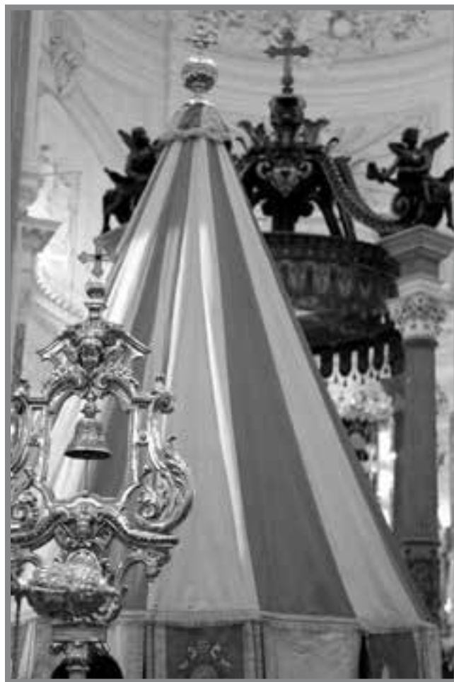
Is-Simboli Bażilikal: It-Tintinnablu, l-Umbrellun u l-Artal Papali