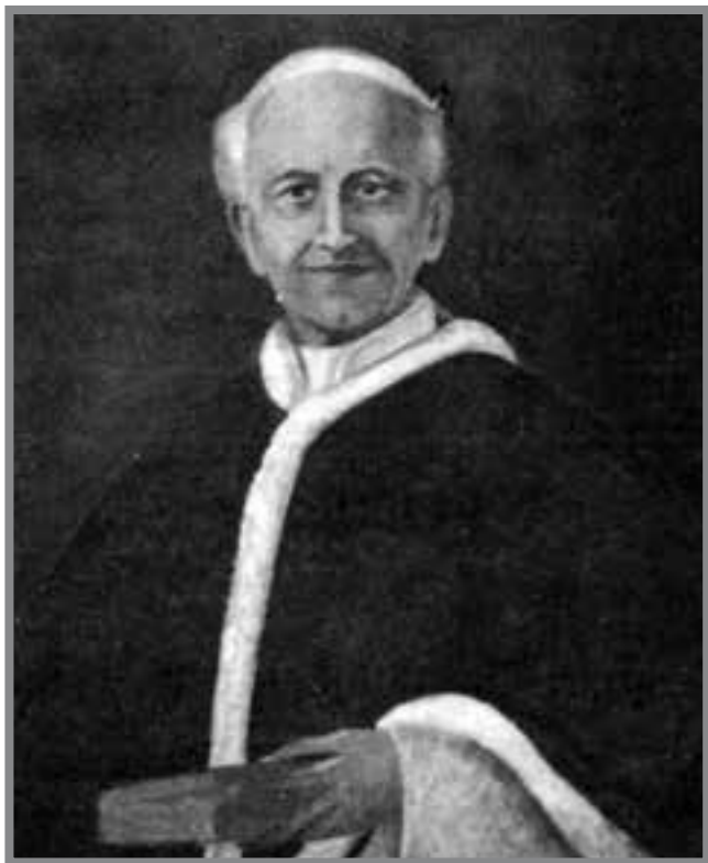
Il-Papa Leone XIII

Għalhekk il-Karmelitani tal-Belt, billi deħrilhom li r-riħ kien favur tagħhom, għamlu l-qalb u