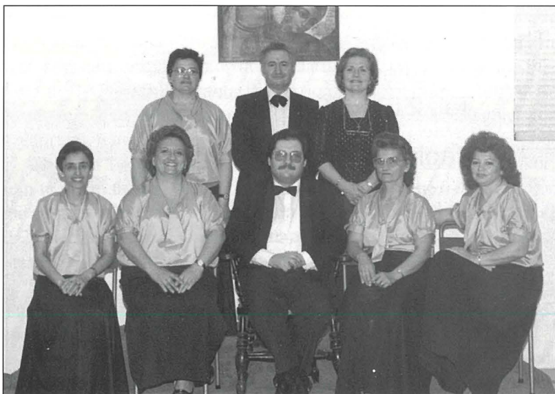
L-ewwel Kumitat (1985)