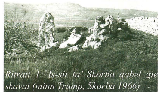
Ritratt 1: Is-sit ta' Skorba qabel ġie skavat (minn Trump, Skorba 1966)

Bhalpostijiet oħra simili, il-fatt li kien hemm haġar kbir ħiereg mill-ħamrija kien joħloq ċertu misteru u anke stejjer