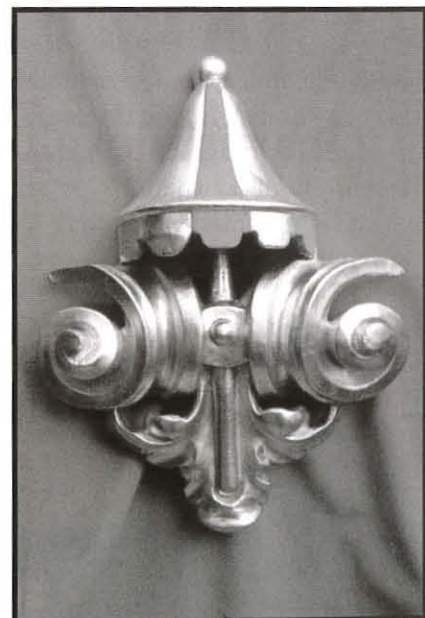
Umbrellun Bażilikal skulturat fl-injam. Kienu fin-nofs ta' l-arkata tal-Bażilika l-ohra, u issa se jkunu fin-nofs tal-gradenza ta' kull artal.