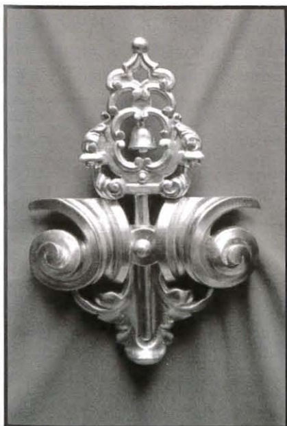
Tintinablu skulturat fl-injam.