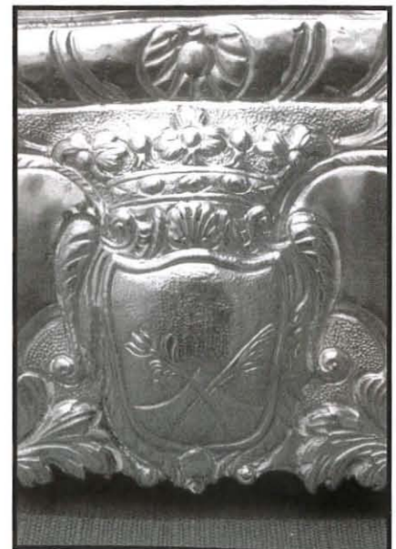
Fl-isfel ta' karta tal-Glorja l-arma tal-Karmnu bla stilel kif kienu f'dak iż-żmien.

Iżda l-pjanta tal-knisja, digà fil-kuntratt imsemmi trid tkun iddedikata lill-Madonna tal-Karmnu, harġet minn id il-Perit Ġlormu Cassar. Fi żmien il-Gran Mastru de la Cassiere (1572-1581) tniżżel fir-registru ta' l-Ordni Ġerosolimitan illi l-Malti Ġlormu Cassar huwa l-arkitett tal-Belt Valletta kif ukoll igawdi l-unur ta' donat jew confrater tar-Reliġjon ta' l-Ordni Ospedaljer ta' San Ġwann; arkitett u inġinier mis-sena 1565 sat-18 ta' April 1581. Matul il-konstruzzjoni tal-Belt Valletta hadem mill-qrib ma' l-inġinieri mibghuta mir-Re ta' Spanja. Iddisinja s-seba' palazzi, imsejha bereġ, tas-seba' lingwi; il-palazz maġisterjali tal-Gran Mastru; il-knisja maġġuri konventwali ta' San Ġwann Battista; il-knejjes partikolari, jiġifieri l-knisja parrokkjali ta' San Pawl, ta' Portu Salv, tal-Karmnu, ta' Santu Wistin u ta' Santa Marija ta' Ġesù. 11