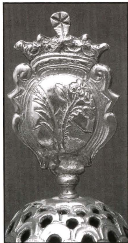
L-arma tal-Karmnu kif kienet dak iż-żmien.

Sistema li segwewha sa l-1586: minn din is-sena 'l quddiem, it-tliet voti li l-Kavallieri ta' Malta għażlu jipprofessaw għand il-Patrijiet Karmelitani fil-Belt, baqghu dejjem jitniżżlu li saru fil-knisja tal-Vergni Mqaddsa Marija tal-Karmelitani mibnija fil-Belt Valletta . Minn dan il-fatt jirriżulta illi din il-knisja tal-Madonna tal-Karmnu tlestiet fis-sena 1586, hekk li bdiet tintuża għall-funzjonijiet sagri. 19