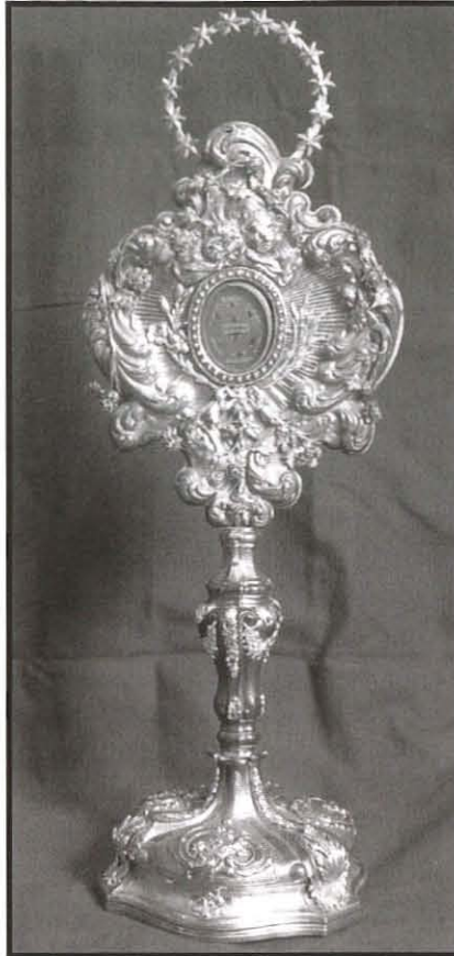
L-Ostensorju li sar għall-purċissjoni ta' l-1622, xi židiet tad-deheb saru iżjed tard.

L-istess knisja Karmelitana kellha fis-sena 1590 artal iddedikat