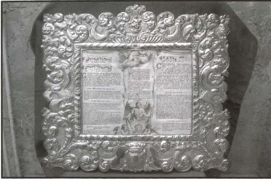
Wahda mit-tliet karti ta' Glorja li kienu saru għall-artal maġġur għall-habta ta' l-1610 skond il-bolla tal-fidda – Ta' l-epoka ta' dan l-artiklu.

1530. Il-Gran Mastru flimkien mal-Kunsill tiegħu u l-kavallieri l-ohra għażlu joqogħdu, fil-Birgu fejn baqghu għall-erbghin sena, meta Fra(ter) Pietro del Monte, is-seba' Gran Mastru li nhatar f'Malta, fost ċerimonji u festi solenni, dahal, nhar it-18 ta' Marzu 1571, fil-Belt il-Ġdida Valletta. 6