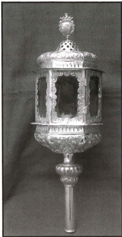
Wahda mill-4 lanterni tal-fidda li saru għall-purċissjoni ta' l-1622.

Pietro del Monte sa G.M. Nikola Cotoner. F'din il-lista ma jissemmiex il-G.M. Annette de Clermont (1660) – fi żmien ma tinstab irregistrata l-ebda professjoni fil-knejjes Karmelitani.