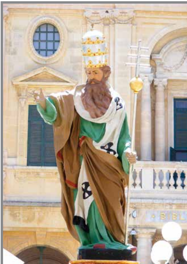
Djonijisu, Isqof ta' Ruma