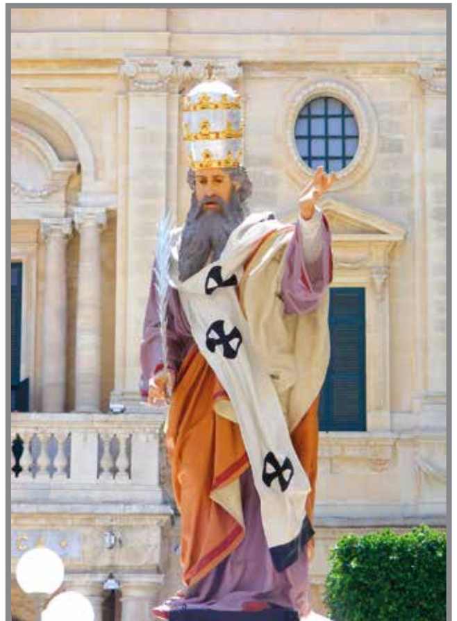
Telesforu, Isqof ta' Ruma