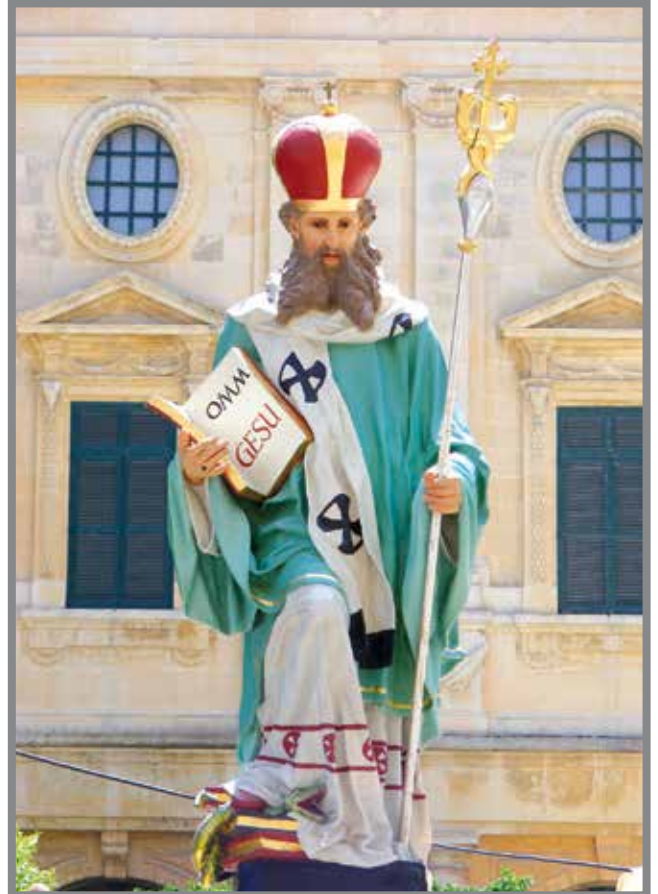
Ċirillu, Patrijarka ta' Lixandra