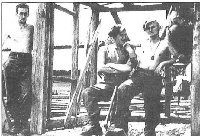
Il-Papa Ġwanni Pawlu II, (it-tieni mil-lemin) jidher waqt mument ta' mistrieħ fil-bini ta' kamp militari f'Lulju ta' l-1939. Tista' tara l-Papa liebes il-Labtu tal-Karmnu.

Biż-żmien, permezz tat-tixrid tad-devozzjoni tal-Labtu mqaddes, dan il-ghana ta' patrimonju Marjan tal-Karmelu sar teżor għall-Knisja kollha. Għas-semplicità u l-valur