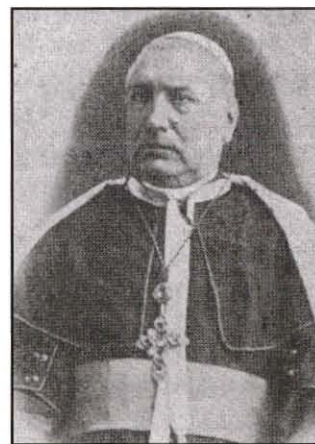
Mons. Salvatore Angelo DeMartis (Karmelitan) Isqof ta' Galtelli Nuoro, Sardegna