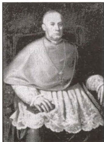
Mons. Carmelo Scicluna, Isqof ta' Malta

Il-Ġimgha, 15 ta' Lulju 1881, Jum l-Inkurunazzjoni. Kulhadd stenna illi f'dan il-jum se jattendu folol kbar ta' nies. Għalhekk sabiex jiġu evitati d-disgrazzji u d-dizordni, il-Pulizija hasbet li tqieghed, sa minn filghodu kmieni, xi kuntistabbli hdejn iż-żewġ bibien tal-knisja tal-Karmnu biex ma jhallux tifforma ruhha xi folla kbira li tista' tikkaguna rassa qawwija fit-tempju jew jinqala' xi storbu minhabba l-folol li jinġabru. (" Risorgimento " l-Erbgha 15 ta' Lulju 1881.)