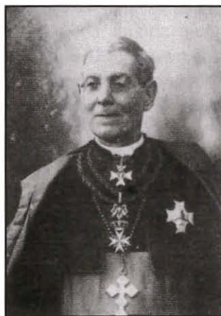
Mons. Pietru Pace Isqof ta' Ghawdex

3. – Malli beda t-Tridu solenni, “ L'Amico del Popolo ” ( 12.7.81 ) talab lir-residenti tal-Belt u l-aktar dawk li joqogħdu qrib tal-knisja tal-Karmnu li juru d-devozzjoni tagħhom lejn il-Madonna permezz ta' illuminazzjoni generali u tat-tiżjin tad-djar.