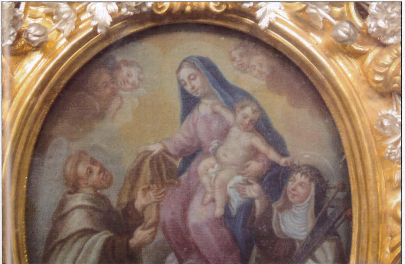
Dettal tal-Pittura. Il-Ferħ ta' San Xmun Stock u Santa Marija Maddalena tiffraħ u taċċetta il-pajgi tal-passjoni minghand il-Bambin Ġesù

Fl-1479 il-Pirjol Ġenerali tal-Karmelitani, Kristofru Martignoni (1471-1481), (dawn in-nisa ta' dak iż-żmien kienu jissejħu 'pinzochere' - jġifieri nisa li jilbsu l-abitu reliġjuż, pero' li mhumiex reliġjużi), ta-hom l-'iskapular', li permezz tiegħu l-monasteru ntrabat li jgħix ħajja klawstrali. Fl-1520 il-monasteru