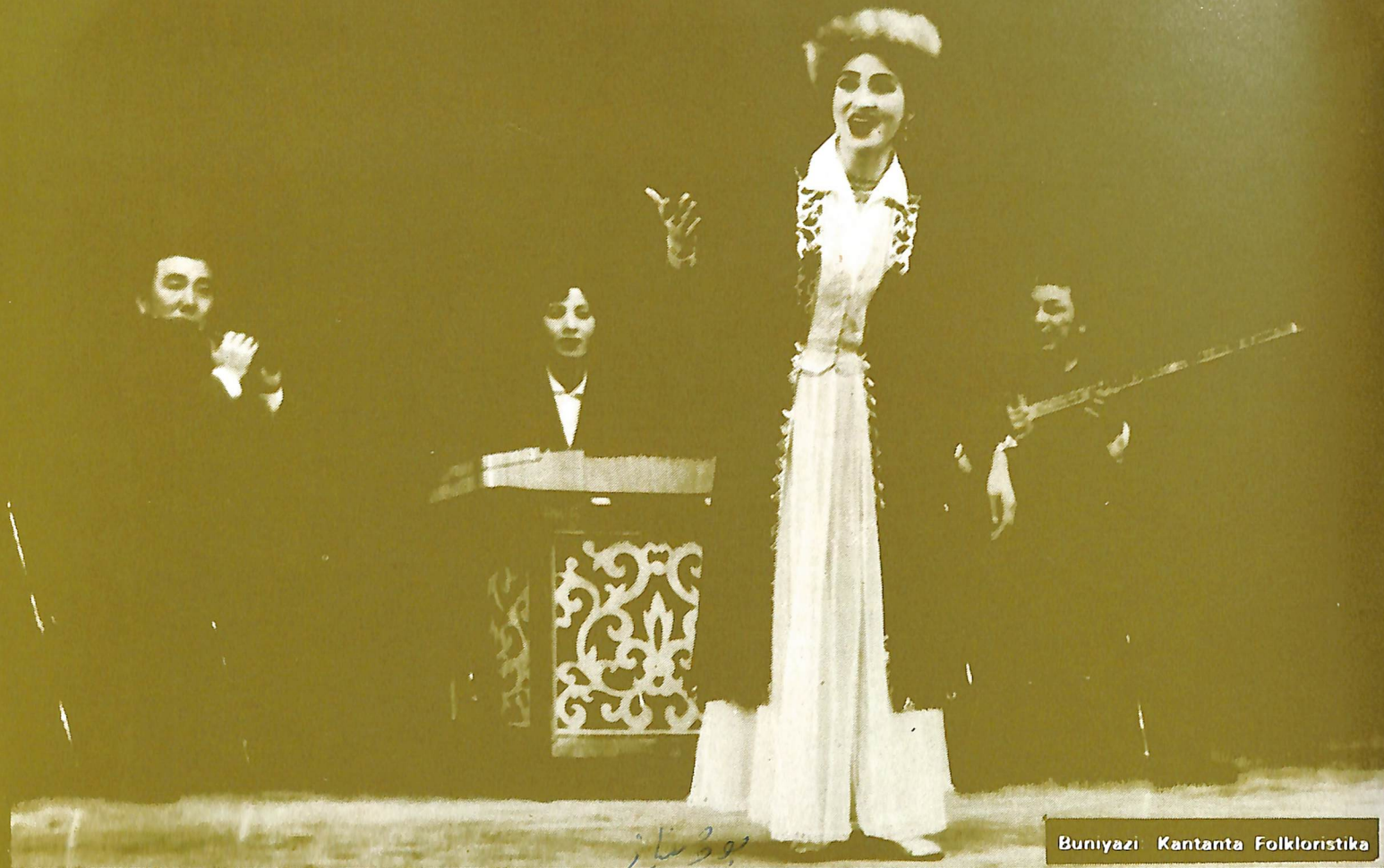
Buniyazi Kantanta Folkloristika