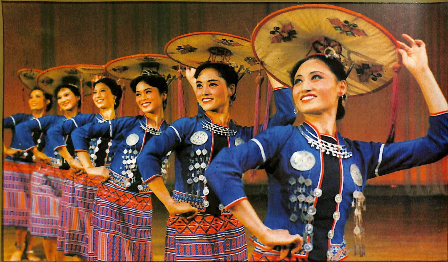
Iz-zifna — 'Kpiepel tat-Tiben'