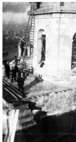
Fuq ix-xellug, it-tqeghid tal-ewwel ġebbla fit-12 ta' Ġunju 1924. Fin-nofs u fuq il-lemin, it-tqeghid tas-salib fuq il-lanterna fit-28 ta' Diċembru 1924.