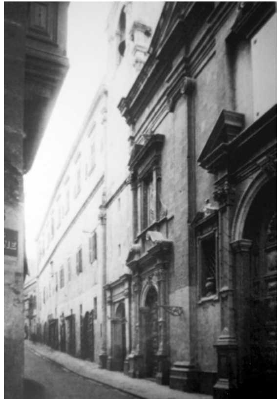
Il-faċċata tal-Knisja l-Ġdida u l-Kampnar Medjevali

Mal-bini tal-knisja l-ġdida, mill-binja l-qadima kien inżamm biss il-kampnar Medjevali, li kien jifred