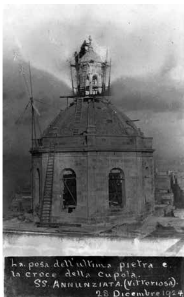
La posa dell'ultima pietra e la croce della cupola. SS. ANNUNZIATA (Vittoriosa). 28 Dicembre 1924.

X'jimporta li ġġarrfet il-ġebbla Mill-koppla saz-zokklu tar-rĥam L-ispirtu qatt jista' jitherra bil-ħbit tal-azzar u tar-ram?! 26