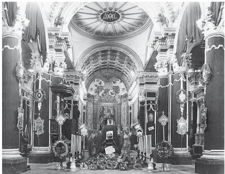
Dehra tal-Knisja tal-Lunzjata fl-1907 qabel ma nbriet il-koppla