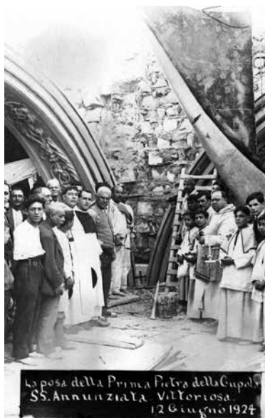
La posa della Prima Pietra della Cupola SS. Annunziata Vittoriosa 12 Giugno 1924