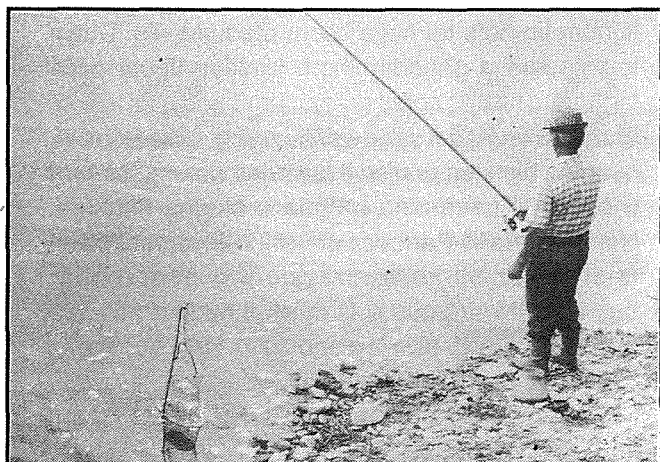
Sajd bil-qasba moderna