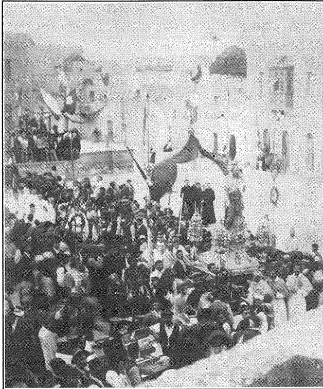
Statwa fil-Festa ta' l-1915

L-istess bhal dik tal-Kuncizzjoni, l-istatwa ta' San Ġużeppe hi prodott tad-ditta famuża Franciza "Gelard". Ix-xogħol tagħha twettaq fil-belt ta' Marsilja mnejn ġew diversi statwi oħra titolari f'Għawdex. Fl-opinjoni tiegħi l-istatwa hi espressjoni stupenda tas-sugġett li tirrappreżenta. Ġesù tarbija, rieked b'idejh fuq sidru, rasu taħt ħaddejn San Ġużeppe, f'mistrieħ shih u naturali, juri b' manjiera l-aktar ċara l-ħarsien ta' missier putattiv. Jidher li l-istatwa kienet speċifikament disinjata biex tesprimi dan il-ħsieb. Il-ħarsa meditattiva ta' San Ġużeppe tkom-