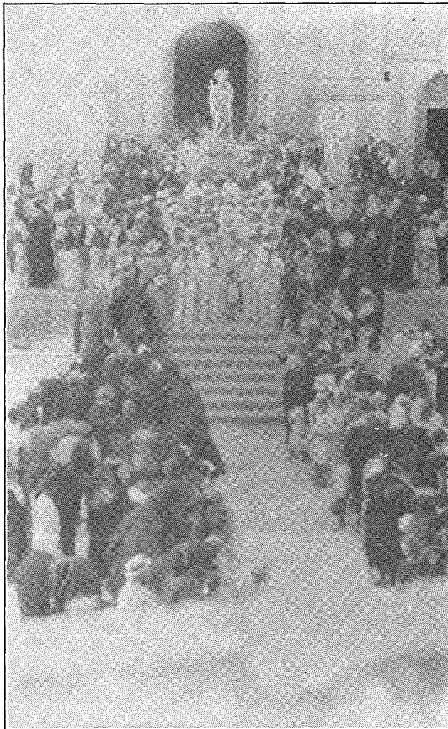
Meta l-istatwa tlibbset b'libsa ndurata, idu restawrata għal bastun, u saritlu dijadema ġdida tal-fidda — Festa 1918

Aktar 'il quddiem, f'Lulju 1958, l-istatwa ta' San Ġużeppe iżzejjnet b'erba' vazetti tal-fidda, xogħol imwettaq mid-ditta "Cassar & Sons" ta' Bormla. Magħhom saru wkoll erba' fjuretti maħdumin mis-Sorijiet Ursulini tal-Belt Valletta. L-ispejjes kollha laħqu £m500, u ġew imħallsin minn