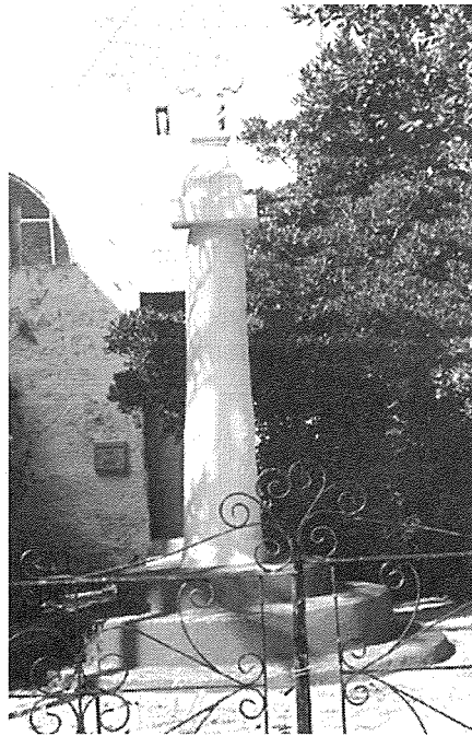
X'sar mit-twemmin ta' niesna? Spiċċa, intemm, jew hemm ġamra taqbad forsi qawwija aktar minn qabel?