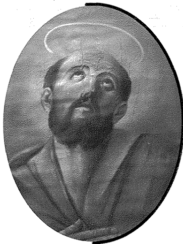
San Eliżew - Pittura ta' waħda mill-bandalori li kienu jintramaw f'Misraħ ir-Repubblika.