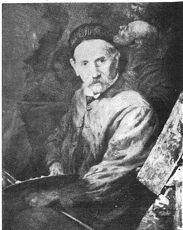
Mill-Kan. Dun Nikol Vella Apap

F'Għawdex il-pittur Ġuzeppi Cali li dwaru sejr in niktbu dan it-tagħrif bijografiku nsibu wkoll xogħolijiet li jkomplu jkabbru l-isem immortali ta' dan il-ġenju artistiku malti. Il-parroċċi f'Għawdex li għandhom xogħlijiet minn tal-Pittur G. Cali huma: Il-Bażilika Kollegġjata ta' San Ġorġ, il-Kollegġjata Bażilika tax-Xagħra, il-Knisja Arċipretali (l-qadima) ta' Għajnsielem, il-Parroċċa ta' San Lawrenz, il-Parroċċa tal-Qalb ta' Ġesù fil-Fontana, is-Santwarju tal-Madonna tal-Grazzja u l-Parroċċa Arċipretali tal-Qala. Din ta' l-aħħar għandha l-kwadru artistiku Titulari li kien tpitter fis-sena 1899 u ġie inkurunat mill-Kardinal Giovanni Colombo, Arċisqof ta' Milan, f'Awissu 1971. 1 Ġuzeppi Cali twieled fl-14 ta' Awissu 1846 fil-Belt Valletta minn Raffaele Cali u Giovanna Padiglione, t-nejn Taljani. Ġie mgħammed f'San Duminku u tawh l-ismijiet ta' Ġuzeppi, Francesco Saverio, Antonio, Mariano u Domenico. 2