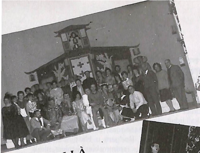
CIN CI LÀ