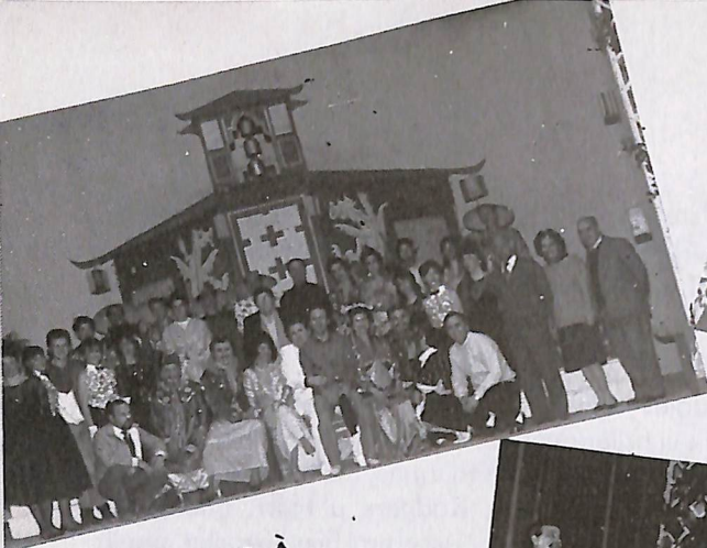
CIN CI LÀ