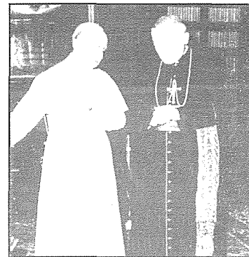
Il-Papa Pawlu VI mal-Kardinal Karol Woytla, il-futur Papa Ġwanni Pawlu II - 1970.