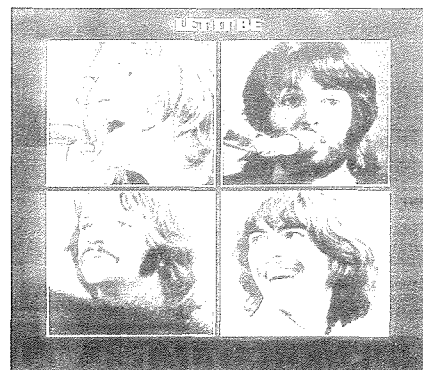
Let it Be, l-aħhar album tal-Beatles 1970