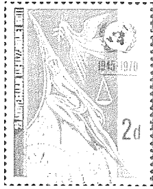
Bolla tal-1970 li tikkomemora il-25 sena tal-Ġnus Maqghuda.

Il-moda taż-żgħażaġh ta' dak iż-żmien kienet iddominata mid-dbielet mini skirt u l-qliezet bell bottom. Il-ġuvintur hafna minnhom kienu jhallu x-xagħarhom twil. Il-karrozzi kienu bdew jinxtraw aktar mill-haddiema. L-aktar karrozzi li kienu popolari kienu l-Escort, il-Capri u Hillman Hunter. Is-Swali taċ-Ċinema dak iż-żmien kienu jkun mimlija, anke fil-irhula. Iċ-ċensura tal-films bdiet terħi anke hawn Malta.