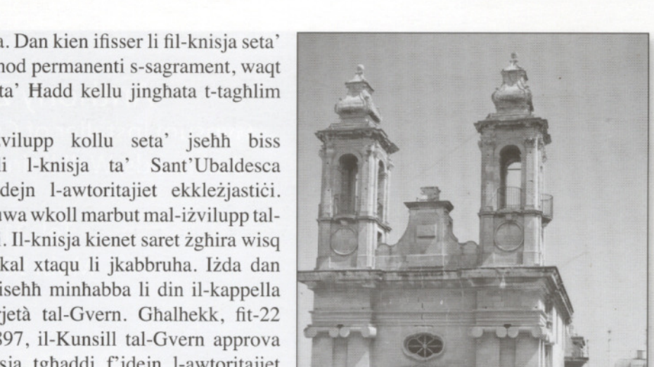
Festa Kristu Re 2010

Quddiem dan l-iżvilupp hekk qawwi ma setax jonqos li jkun segwit minn żviluppi spiritali. Il-bżonn tal-amministrazzjoni ta' preċetti sagramentali speċjalment dawk tal-vjatu wasslu għall-bżonn ta' holġien ta' parroċċa ġdida. Il-kobor tar-rahall beda jwassal biex xi drabi l-vjatu ma jilhaqx jasal fil-hin. Għalhekk inbeda l-proċess burokratiku biex Paola tingħata awtonomija mill-Parroċċa ta' Hal Tarxien. Fis-7 ta' Marzu 1905, il-Kapillan ta' Hal Tarxien Attard, talab formalment biex iż-żona ta' Paola ssir viċi parroċċa. Dan kien ifisser ċert li ġo Sant' Ubaldesca seta' jinzamm is-sagrament u għalhekk kien ikun aktar faċli biex jingħata l-vjatu. Iżda għall-ewwel darba, l-Isqof Pace irraġixxa fin-negattiv bħalma turi biċ-ċar l-ittra li hu bagħat fl-10 ta' April. Kien imiss issa grupp żgħir ta' nies minn dan il-post biex fit-23 ta' Mejju jifformaw petizzjoni, li giet iffirmata minn 278 ruh biex Paola ssir viċi-parroċċa. Din id-darba, l-Isqof aċċetta u fid-29 ta' Lulju laqa' formalment it-talba tagħhom waqt li talab lil-Kapillan ta' Hal Tarxien biex jurih min xtaq li jmxexxi lil din il-viċi-parroċċa ġdida. Ma damitx ma wasslet ir-risposta u fis-16 ta' Awissu, il-Kapillan Attard għażel lil Salv Busuttill, qassis habrieki fuq din ix-xaqliba, għal dan is-servizz. B'hekk, fid-29 ta' Awissu, permezz ta' digriet mill-Kurja, Rahal Gdid gie ddkjarat