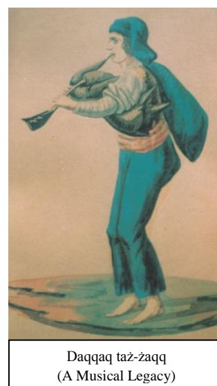
Daqqaq taż-zaqq (A Musical Legacy)

Fl-istess kitba ta' Grima naqraw ukoll li tradizzjoni hafna iżjed antika hija l-hami tal-qagħaq tal-għasel jew tal-qastanja. Dal-qagħaq jissemma f'taqbila antika Maltija li għadna nisimghuha sal-gurnata tal-lum u li tibda hekk: " Ninu, Ninu, tal-Milied, / Ommi tagħmel il-qagħqiet; / Il-qagħqiet tal-qastanja ... "