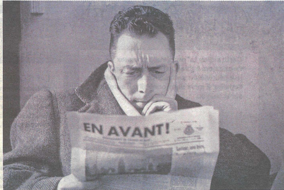
Albert Camus, Filsofu Franciż

b) Hemm veritajiet evidenti oħrajn, din id-darba storiċi. Kull darba li xi duttrina ltaqgħet mal-baċir Mediterranju, fil-habta t'idejat li segwi-