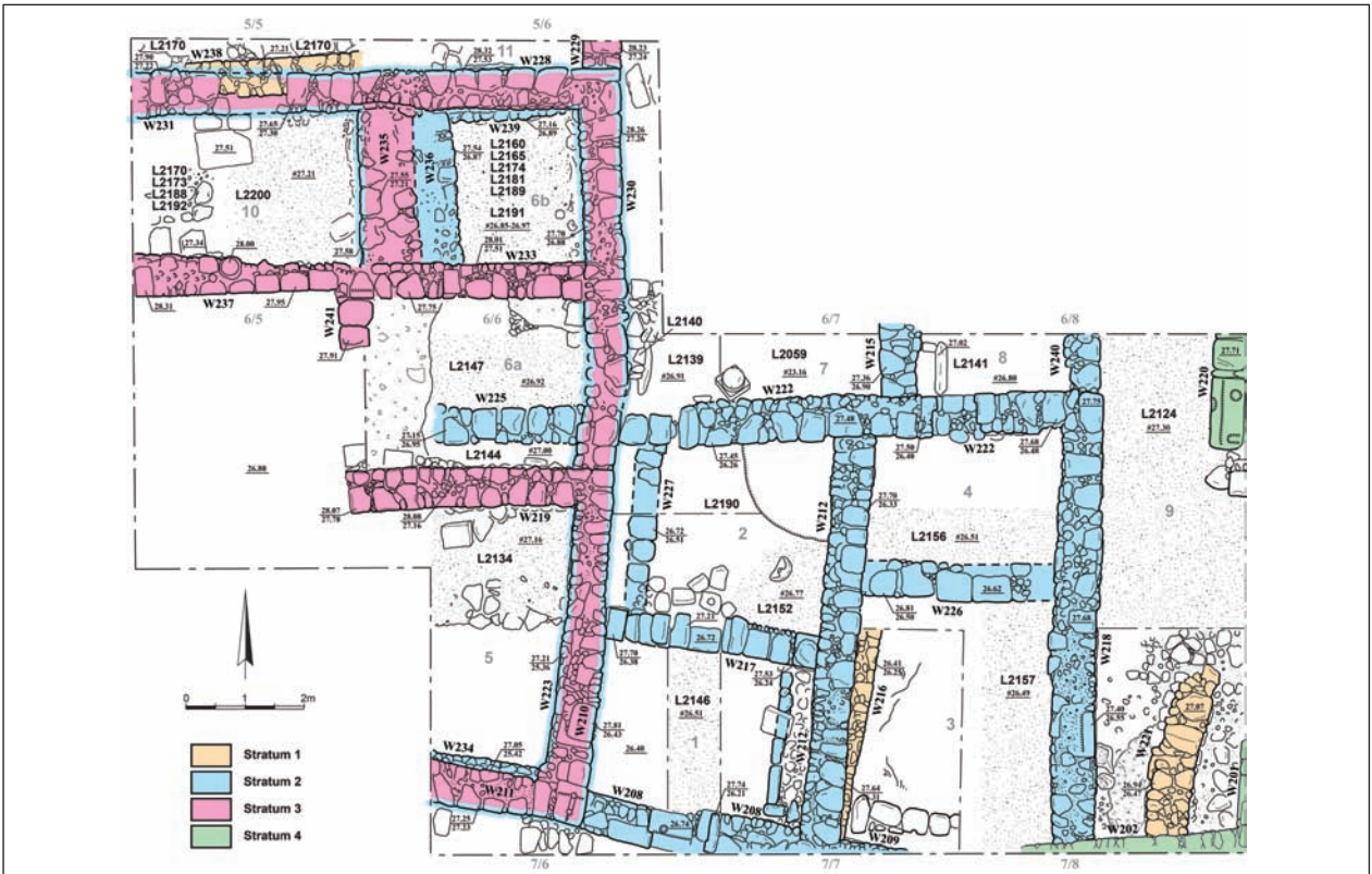
תצלום ותכנית של שרידי מבני המגורים בשטח 2000