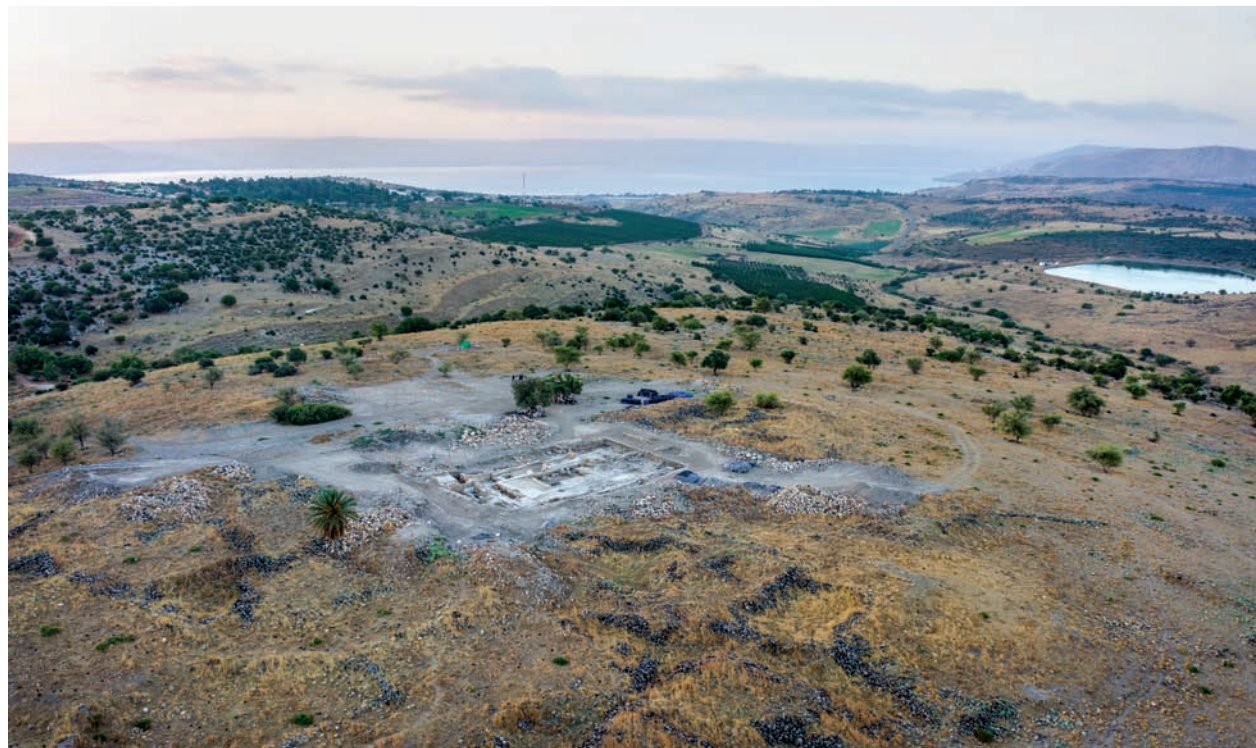
מבט מהאוויר לכיוון דרום-מזרח ולכנרת על אתר החפירות בחוקוק

וַיְהִי גְבוּלָם מִחֶלֶף מֵאֵלֹן בְּצַעַנְיִים וְאֲדָמִי הַנֶּקֶב וַיִּבְנֶאֱלֵעַד לְקוּם וַיְהִי תְּצַאֲתָיו הַיַּרְדֵּן. לִי וְשֵׁב הַגְּבוּל יָמָּה אֲזוּזֹת תָּבוּר וַיֵּצֵא מִשָּׁם חוֹקְקָה וּפְגַע בְּזַבְלוֹן מִנֶּגֶב וּבְאֶשֶׁר פָּגַע מָיִם וּבִיהוּדָה הַיַּרְדֵּן מִזְרַח הַשָּׁמֶשׁ.