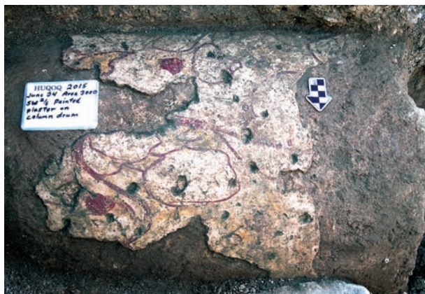
חוליית עמוד מכוסה בטיח מצויר מבית הכנסת שנמצאה בשימוש משני כתמיכה לסטילובט הבניין מימי הביניים