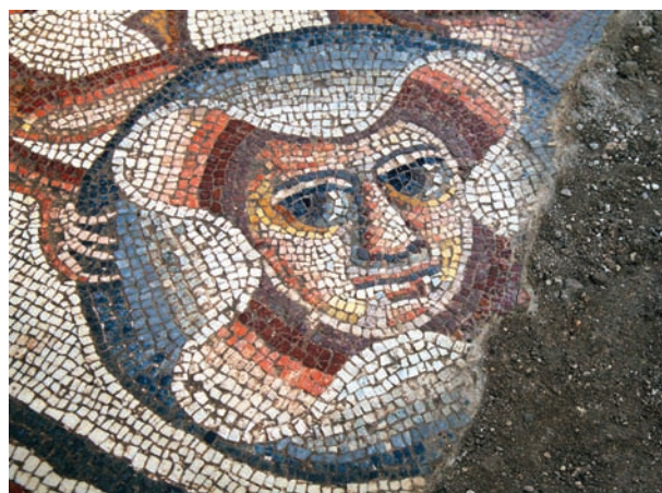
ספרה עם ראש אדם או מסכה בספין ההקדשה

ברצועה העליונה מוצג מפגש בין שתי קבוצות גברים ובראש כל קבוצה ניצבת דמות שחשיבותה מודגשת על ידי גודלה ומיקומה. חברי כל קבוצה מביטים בציפייה על המפגש הדרמטי שבין הדמויות הראשיות. מפגש זה, הנראה כרגע של פיוס, הוא מוקד התיאור ברצועה העליונה ושיאו של הסיפור כולו המוצג בספין זה. הקבוצה שבצד שמאל כללה במקורה שמונה גברים אוחזים בידם חרבות ובראשם גבר קשיש בעל זקן ושער שיבה. כל הדמויות לובשות טוניקות וגלימות – אלו הן אותן הדמויות הנראות ברצועה האמצעית. ראש הקבוצה מצביע באצבע ידו הימנית כלפי מעלה, בוודאי לשמים, ומחזיק בידו השמאלית חפץ, אולי מטבע או חרב, שאותו הוא מציע לדמות הגדולה השנייה, שממולו.