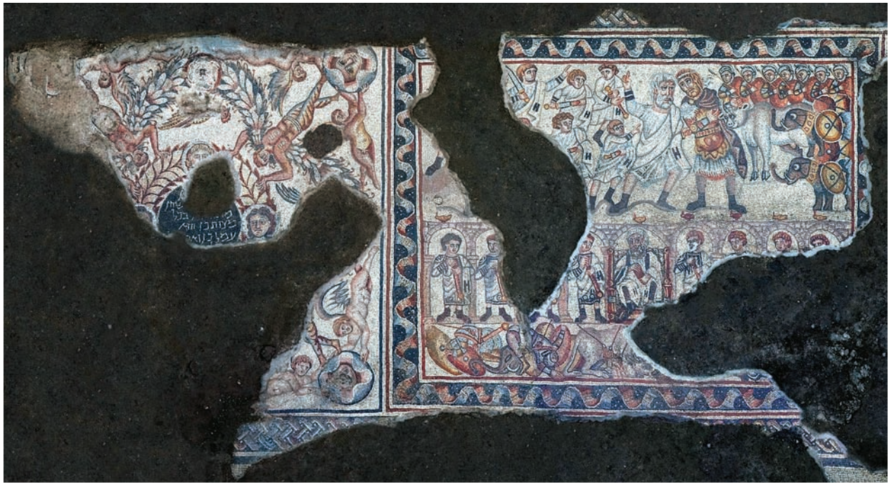
ספין הפילים (מימוץ) וספין ההקדשה (משמאל)