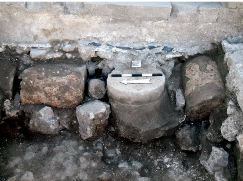
חוליות עמודים מבית הכנסת שנמצאו בשימוש משני לתמיכת הסטילובט של הבניין מימי הביניים