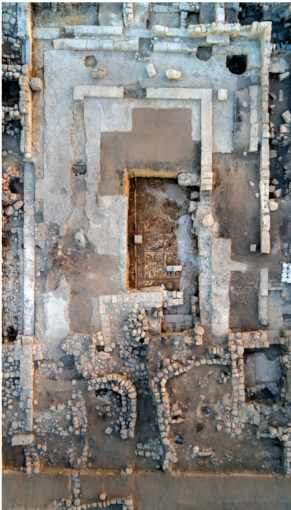
תצלום אוויר של בית הכנסת והמבנה מימני הביניים בסוף עונת 2017. בהיקף נראים הקירות החיצוניים והסטילובט של המבנה, ובמרכז הפסיפסים שנחשפו בחלקו הדרומי של אולם התווך של בית הכנסת.