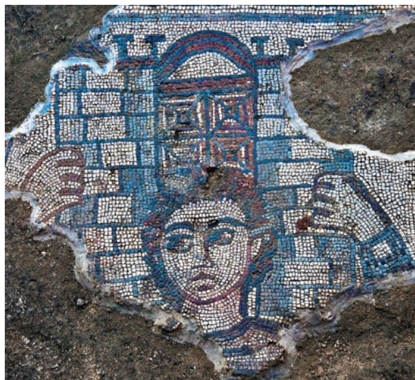
שמשון נושא את שער עזה

צפונית לספין ההקדשה נמצא ספין גדול ובו פסיפס יוצא דופן מכל הבחינות – פסיפס הפילים. בניגוד לשאר הספינים שלאורך הסיטרה המזרחית, ספין ההקדשה וספין הפילים פונים מזרחה, וייתכן שיש בכך כדי להעיד על קיומו של פתח בקיר המזרחי של המבנה. התיאור בספין מחולק לשלוש רצועות המתרחבות כלפי מעלה. מדובר כנראה בסיפור ששיאו מתואר ברצועה העליונה, במפגש בין שתי הדמויות הגדולות. הרצועה התחתונה מציגה כנראה סצנה לאחר קרב, שבה נראים גופותיהם של חיילים וגם פר ופיל ורוכבו. הרצועה האמצעית מתארת ארקדה עם דמויות של שמונה נערים ניצבים בתוך קשתות ואוחזים בניצבי חרבות נתונות בנדנים. במרכז, ביניהם, יושבת דמות גדולה יותר של גבר. כל הגברים לובשים טוניקות וגלימות מקושטות באות היוונית Η ( eta ). סמל המצביע על מעמדם הגבוה. מעל כל אחד מהם מוצב נר דולק. הדמות בגומחה המרכזית היא של גבר בעל שער שיבה, יושב על כס ומחזיק מגילה.