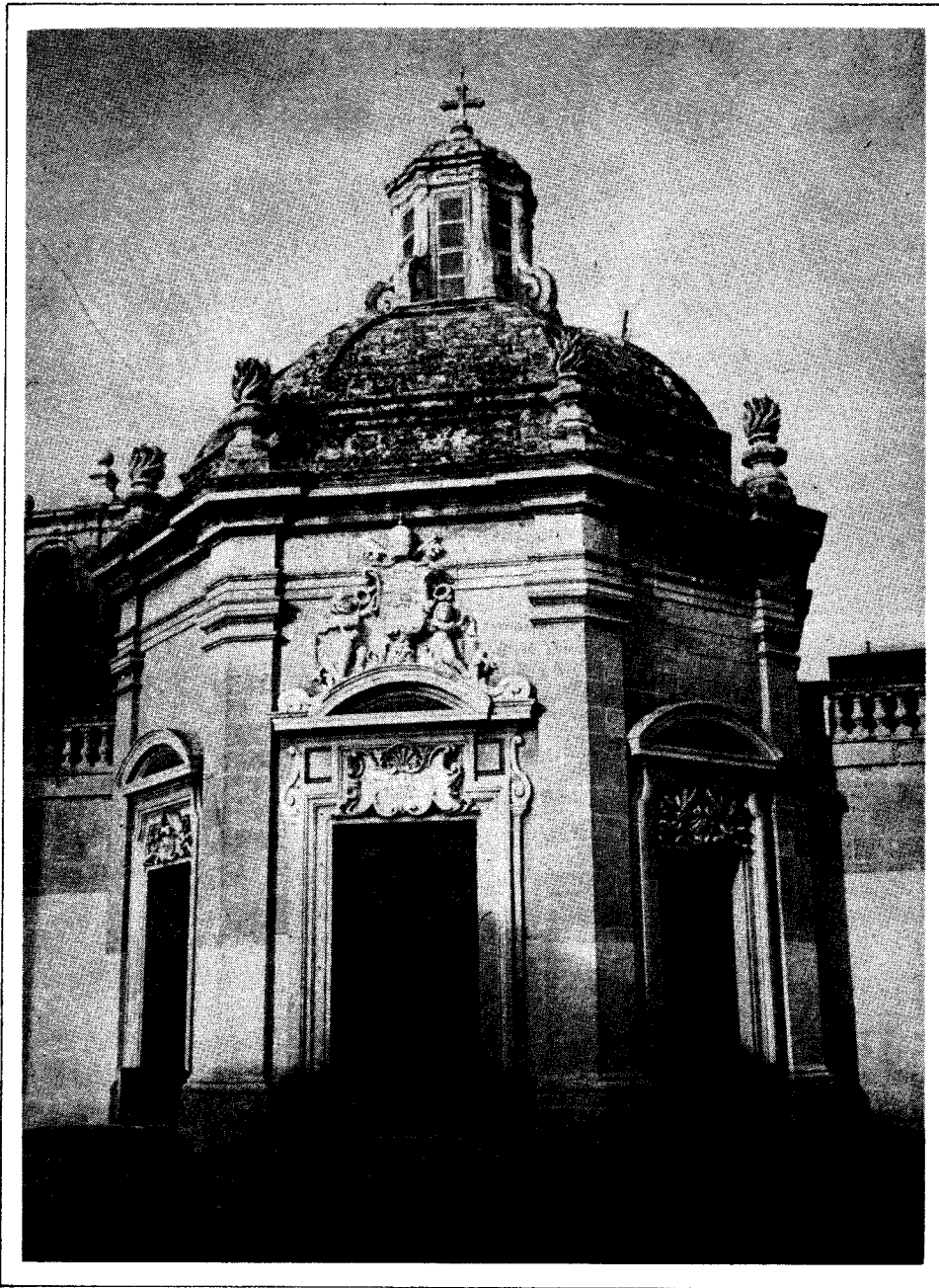
The chapel of Our Lady of Sorrows, Žebbuġ (see p.122).