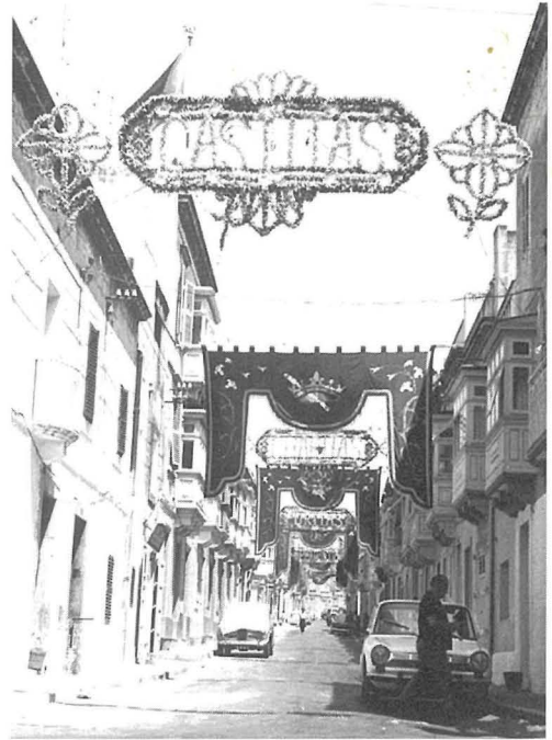
Strada Seconda illum Triq Antonio Bosio armata bid-disinnji tal-karti kkuluriti għall-festi Ċentinarji tal-Parroċċa f'Luġu 1967

Dan kien johloq sens ta' pika ġenwina, biex is-sena ta' wara jarmaw aħjar. Il-ġbir tal-flus kien isir kull ġimgħa bieb bieb u l-ewwel sitt xhur il-ġbir kien imur għall-knisja biex isir id-damask. Dan ma kien isir qatt. Sakemm fis-sena 1987 sa 1990 sar mill-Kummissjoni Amministrattiva mill-flus li ġabret hi mill-Candle Factory. Kienu jsiru lotteriji, fieri fuq il-moll, xi tombli bil-premju ta' lira u tkun qisek irbaħt xi ħaġa kbira. Niftakar ukoll il-lotterija tal-ghoġol li kienet issir kull sena fuq iz-zuntier, dan barra l-ġbir fuq iz-zuntier ta' sold sold biex isiru l-logħob tan-nar. Dun Innoċenz kien jieħu ħsieb ukoll li jagħmel repò fis-sala fuq id-dar parrokkjali. Dakinhar mill-isqof sal-inqas abbati u dilettant tal-festa kien imissu dak ir-rikonoxximent zgħir li kulhadd jistenna u b'dan ir-rikonoxximent u sens ta' grazzi kulhadd jibda jaħdem għal sena oħra. Dan illum naqas.