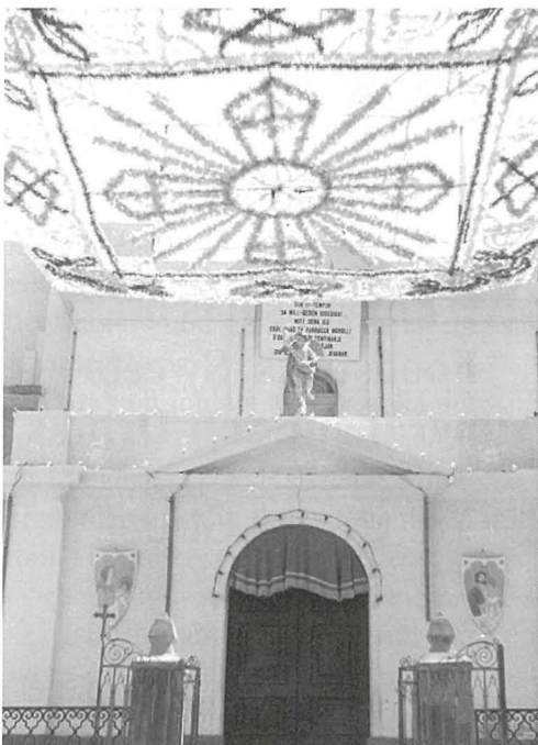
Kannizzata quddiem il-Knisja tal-Kunċizzjoni armat għall-festi Ċentinarji tal-Parroċċa f'Lulju 1967

Fuq barra l-festa kienet tibda l-Ġimgħa filgħaxija wara l-barka meta kienet issir mixgħla ġenerali tat-toroq. Wara l-Banda Melita kienet tagħmel il-marċ tradizzjonali tagħha li kien jibda minn quddiem il-knisja u jitla' minn Strada Terza (Mons. Dandria), Triq il-Ġdida, D'Argens, Triq il-Kunċizzjoni kollha, Triq il-Wied u jispicċa fil-11:00 p.m. quddiem il-kazin. Is-Sibt il-Banda Melita, kienet tagħmel marċ qasir u programm mużikali fuq il-planċier quddiem il-knisja. Wara kien isir