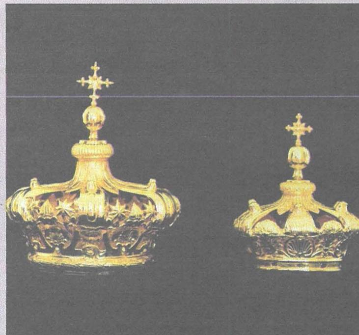
Il-kuruni li se jsebbhu ras il-Madonna tal-Qalb Imqaddsa ta' Ġesù u l-Bambin f'idejha li jsebbhu l-istatwa storika meqjuma fil-knisja parrokkjali tas-Sacro Cuor f'Tas-Sliema

Sadattant hi l-parroċċa li qed tafda lill-Fraternità Frangiskana f'għeluq il-mitt sena mit-twaqqif tal-parroċċa dawn il-kuruni għall-inkurunazzjoni solenni li se ssir għada s-Sibt 29 ta' Settembru mill-Arċisqof Charles J. Scicluna u b'hekk il-parroċċa ssir is-Santwarju Marjan f'Tas-Sliema.