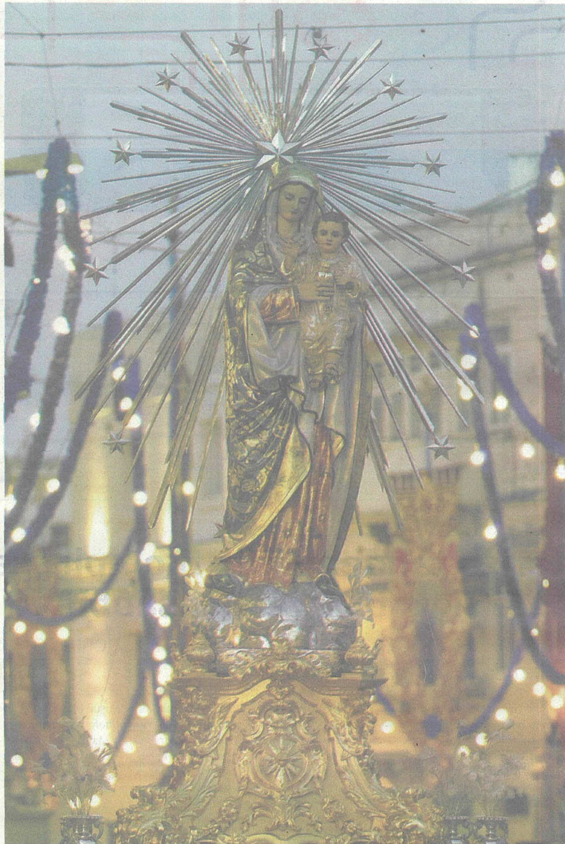
L-istatwa devota tal-Madonna meqjuma fil-knisja parrokkjali tas-Sacro Cuor ta' Tas-Sliema, xogħol l-iskultur Senglean Glormu Darmanin

Hawn johroġ l-għaqal ta' Dun Pawl. Hu heġġeg lill-Kumitat, imwaqqaf biex jirsisti għal bini