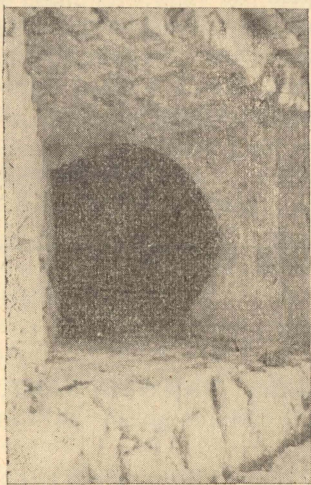
Il-Għar mudlam, li ġewwa fih tinsab il-għajn tal-ilma li bis-saħħa tagħha nbniyet Gerusalem.

Il-ghorrief ta' zminijietna jghidu li Gerusalem kellha l-bedu tagħha minn ftit djar mibnijin fuq ilsien ta' art, bejn żewġ widien, qrib għajn ta' l-ilma li kienet ġewwa għar f'qiegħ il-wied. Dawk in-nies li kienu jghixu f'dawk id-djar darba waħda ġew imkeċċijin min-nies aqwa minnhom li, fil-Kotba ta' l-Għaqda l-Qadima, huma msemminjati Kangħanin, meta daħlu fil-Palestina qrib it-3,000 sena qabel it-twelid ta' Kristu. L-ghorrief saru jafu dan mill-hafna għodod u fuhħar ta' Żmien il-Haġar u ta' Żmien il-Bronz li nstabu f'dawk l-inhawi.