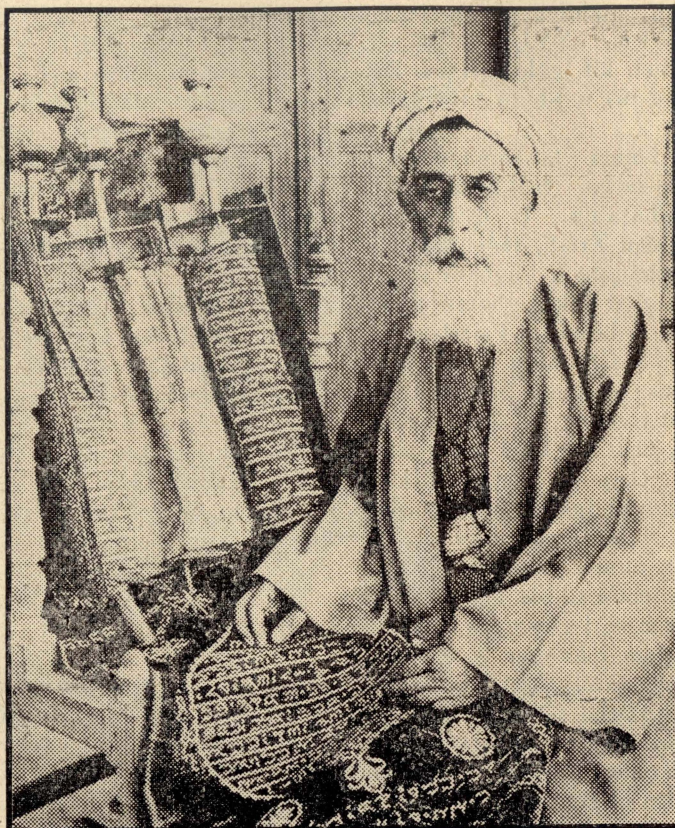
Nies tal-Palestina — Qassis tas-Samarijin bil-manuskritt miktub bl-Ghebrâni, li huma jghîdu li kitbu Mosè.

Meta Muhammed beda jghallem Dînu, l-Insâra kienu l-anqas nies li