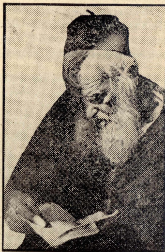
Nies tal-Palestina — Mghallem tad-Dîn Lhûdi jaqra l-Kotba Mqaddsa.

issa, hi t-tbatija li ghedîn ibâtu dawki l-Gharab li sfaw bla dâr, wara l-gwerra tal-Lhûd maghhom, ghax il-Lhûd hadulhom djarhom u mielhom, biex irewwmu pajjizhom (1).